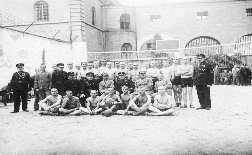
Fot. 3. Zajęcia z wychowania fizycznego w więzieniu w Kaliszu