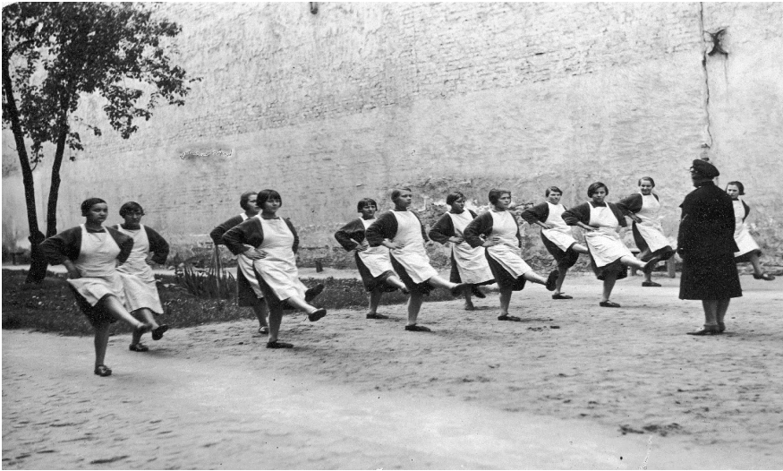
Fot. 2. Więźniarki podczas ćwiczeń w więzieniu w Tarnowie

było wypracowanie w osadzonych poczucia dyscypliny, zapobieganie – poprzez regularne ćwiczenia gimnastyczne i sportowe – ujemnym skutkom pozbawienia wolności na stan zdrowia więźniów. Wychowanie fizyczne realizowano w salach gimnastycznych (jeśli w zakładach takie istniały) albo na specjalnie do tego celu przygotowanych terenach ćwiczebnych, o ile to możliwe na świeżym powietrzu. Ćwiczenia odbywały się pod kierunkiem wykwalifikowanych instruktorów oraz pod nadzorem lekarzy. Istotne było także to, że wychowaniem fizycznym objęci zostali wszyscy więźniowie – zarówno mężczyźni, kobiety, jak i małoletni 23 .