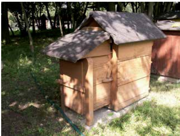
Ryc. 7. Ul Ciesielskiego z przystawką w zbiorach Skansenu Pszczelarzkiego w Swarzędzu k. Poznania.

Problematyka ta nie tylko zapełniała szpalty Bartnika Postępowego . Przedmiotem troski prezesa Towarzystwa i zarządu było, by równolegle znajdowała wyraz w programach i treści działań organizowanych dla pszczelarzy, sadowników, gospodarzy i gospodyń wiejskich, by była obecna w takich formach pracy stowarzyszenia jak: kursy z dziedziny pszczelnictwa lub ogrodnictwa, względnie szkolenia o tematyce łączonej, odczytów i pogadarek, poletek i pokazów wdrożeniowych itp. Początkowo prowadził je profesor Ciesielski, z roku na rok wspomagany coraz liczniejszą rzeszą współpracowników i pomocników w osobach przeszkolonych działaczy terenowych, współpracujących z Towarzystwem nauczycieli wiejskich, w końcu także nielicznej kadry etatowych instruktorów organizujących pokazy, demonstracje sposobów wdrażania nowości, promujących wzorcowe przydomowe ogrody i pasieki, przydomowe sady, organizujących rejonowe wystawy i inne formy oddziaływania na świadomość ludności wiejskiej.