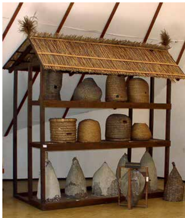
Ryc. 6. Kószy – ule wyplatane ze słomy, których od kilkudziesięciu lat próżno szukać w ukraińskich i polskich pasiekach. Muzeum w Gödöllő.

zróżnicowany wachlarz informacji, doniesień i artykułów z dziedzin ogrodnictwa i sadownictwa, porad fachowych o chowie drobnego inwentarza, uprawie grzybów jadalnych, pielęgnacji przydomowych ogrodów, zakładaniu i prowadzeniu inspektów itp. Decyzję tę uzasadniały m.in. względy ekonomiczne, bowiem ówczesnym działaczom zajmującym się problematyką gospodarstwa wiejskiego wydawało się, że wielokierunkowość produkcji gospodarstw chłopskich zwiększała ich ekonomiczne bezpieczeństwo – w przypadku niepowodzenia któregośkolwiek kierunku produkcji, w tym także pasiecznej, zmniejszała automatycznie ryzyko prowadzenia gospodarstwa.