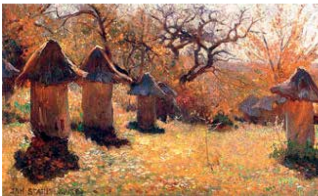
Ryc. 5. Ule na Ukrainie J. Stanisławskiego (olej, 1895) – to jedno z nielicznych dzieł dokumentujących zanikające z galicyjskiego krajobrazu z końcem XIX wieku pasieki, które królowały tu przed przybyciem prof. Ciesielskiego.

gospodarstwa wiejskiego, które prócz pszczelarstwa wchodziły w zakres zainteresowań Towarzystwa. Kierunek i ciężar tej działalności coraz bardziej przechylał się w stronę galicyjskiego chłopstwa, w oparciu o sieć szkół ludowych oraz wiejską inteligencję. Osoby odpowiednio przeszkolone na kursach Towarzystwa zdolne były realizować na wsi prace wynikające z celów zapisanych w statucie Towarzystwa.