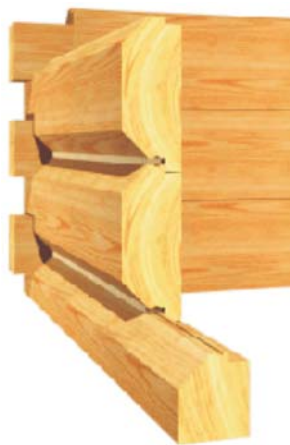
Rys. 1. Ściana z płazów [4, 5] Fig. 1. The wall of logs [4, 5]

Ze względu na zbieżystość drzewa każda płaza ma różną szerokość na obu końcach, co wiąże się ze specjalnym sposobem układania płaz przy budowie ścian, tak aby cieńsze i szersze końce były układane naprzemiennie. Ścięcie oflisu ma wpływ jedynie na wygląd ścian zewnętrznych budynku, właściwości izolacyjne w obu przypadkach są bardzo podobne. W celu poprawienia izolacyjności budynku stosuje się płazy felcowane (rys. 1). Są to płazy wyprofilowane w taki sposób, aby zachodziły jedna na drugą w budowanej ścianie. Ich przygotowanie wymaga większych nakładów robocizny i znacznego zużycia materiału. W przypadku ścian zbudowanych z płazów felcowanych mszenie, czyli uszczelnienie ścian, widoczne jest tylko z zewnątrz, wewnątrz budynków prawie nie widać miejsc zetknięcia płazów.