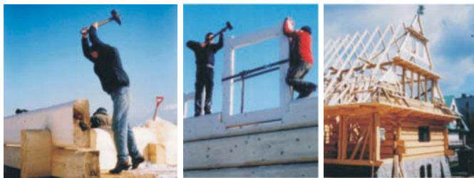
Rys. 3. Etapy budowy domu z bali: a - stawianie ścian, b - wbiwanie słupa wiązanego, c - wykonanie konstrukcji dachowej [4, 5]