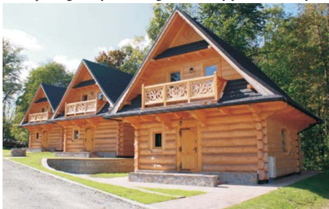
Rys. 4. Domy letniskowe

Następnie wykańcza się wnętrze budynku, a na końcu układa podłogi. Przykładowe gotowe domy pokazano na rys. 4.