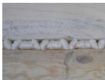
Rys. 2. Wzory wełnionki zwijanej i wbijanej w szczeliny między balami