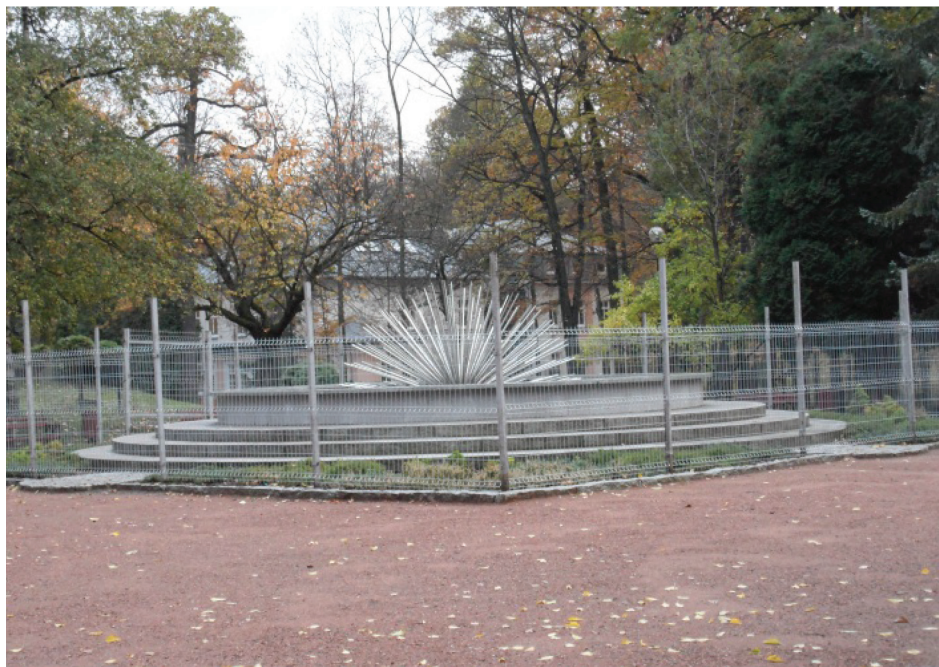
Fotografia 12. Fontanna nieopodal byłego Domu Zdrojowego (listopad 2012)

te elementy stanowią mogą wzór dla niektórych funkcjonujących uzdrowisk, jak należy aranżować tego typu przestrzeń, bacząc przede wszystkim na topografię terenu.