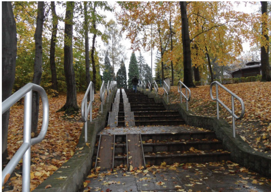
Fotografia 11. Park Zdrojowy, schody terenowe dostosowane dla osób niepełnosprawnych i matek z małymi dziećmi Photo 11. The Spa Park, terrain stairs adapted for the disabled and mothers with small children

sanatoriami „Mieszko”, „Dąbrówka” (dawna „Betania”), pawilonem nr 3 (dawne sanatorium Spółki Brackiej), willą „Opolanka”, zespołem klasztornym i kościołem pw. Najświętszego Serca Pana Jezusa (dawny Zakład Marii) i „Domem Aniołów Stróżów”, został wpisany do rejestru zabytków klasy „A”.