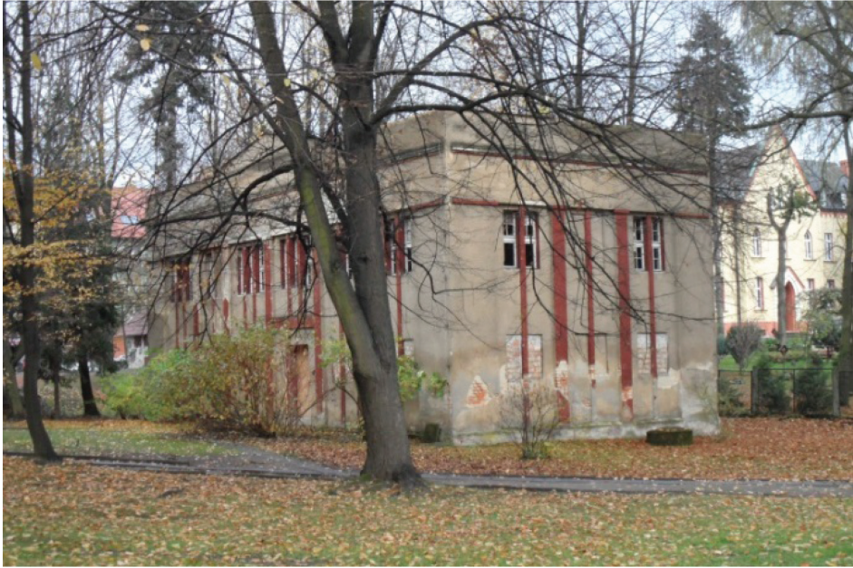
Fotografia 8. Łazienki III (1920 r.) – obecnie budynek w ruinie (fot. autorki, listopad 2012 r.)