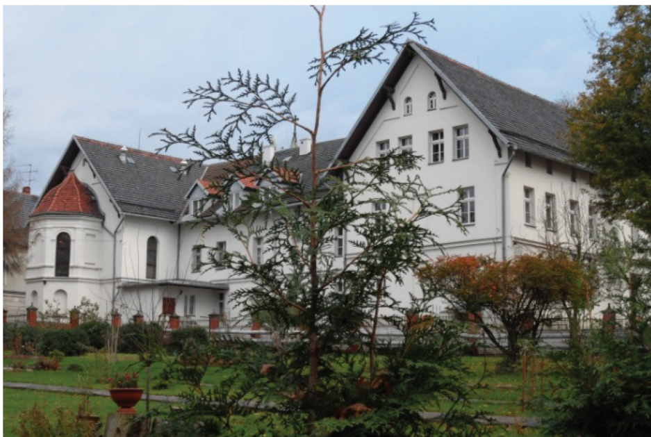
Fotografia 7. Dawny Zakład Marii, Katolicki Zakład Dziecięcy (1891 r.) – obecnie Kościół rzymskokatolicki pw. Najświętszego Serca Pana Jezusa oraz zespół klasztorny sióstr Boromeuszek (listopad 2012 r.)

Photo 7. The former Mary Facility, a catholic Childrens' Facility (1891) – currently the roman catholic Most Sacred Heart of Jesus church and a monastery complex for the Sisters of St. Borromeo (November 2012)