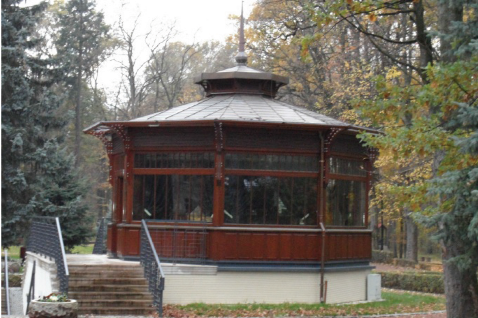
Fotografia 4. Pijalnia wód z 1861 r. w Parku Zdrojowym (fot. autorki, listopad 2012) Photo 4. The Water Drinking House in the Spa Park from 1861 (photo by authoress, November 2012)

zusa (3 ćw. XIX w.); budynek byłego Szpitala Kolejowego (1909); pijalnia wód (1861); muszla koncertowa (1862); budynek Betania III – obecnie hotel i restauracja „Dąbrówka”.