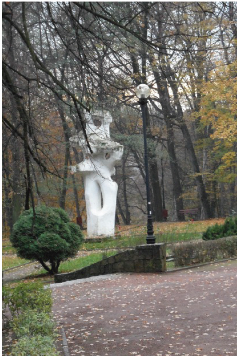
Fotografia 14. Rzeźba w Parku Zdrojowym – Tańcząca para (fot. autorki, listopad 2012)

lenia mogły korzystać z ich zdrowotnych walorów, tak, by ocalić uzdrowskie dziedzictwo kulturowe.