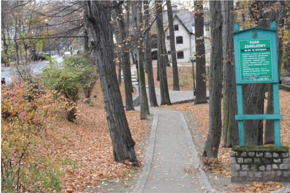
Fotografia 13. Tablica informacyjna o Parku Zdrojowym, dobrze utrzymane ścieżki spacerowe (fot. autorki, listopad 2012)