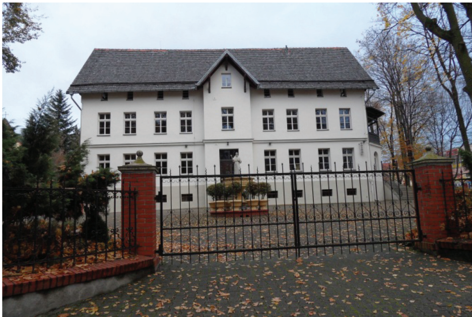
Fotografia 5. Dom św. Józefa (1895 r.) w zabytkowym zespole klaszornym sióstr Boromeuszek – obecnie klasztor sióstr Boromeuszek (fot. autorki, listopad 2012 r.) Photo 5. St. Joseph's House (1895) in the historic monastery complex of the Sisters of St. Borromeo – currently also a monastery for the Sisters of St. Borromeo (photo by authoress, November 2012)

Do zabytkowych obiektów pouzdrowiskowych należą także: budynek sanatorium Spółki Brackiej – obecnie siedziba Ośrodka Działalności Dydaktycznej Uniwersytetu Śląskiego; okazały gmach byłego „Sanatorium dla Inwalidów Wojennych i Powstańców im. Marszałka Piłsudskiego” – obecnie Wojewódzki Szpital Rehabilitacyjny dla Dzieci (Siemko 1992).