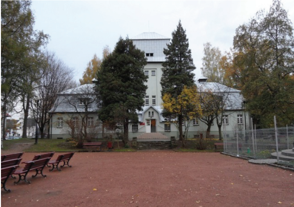
Fotografia 6. Łazienki II (1912 r.) usytuowane naprzeciw Domu Zdrojowego – obecnie Miejski Ośrodek Kultury, Galeria Historii Miasta