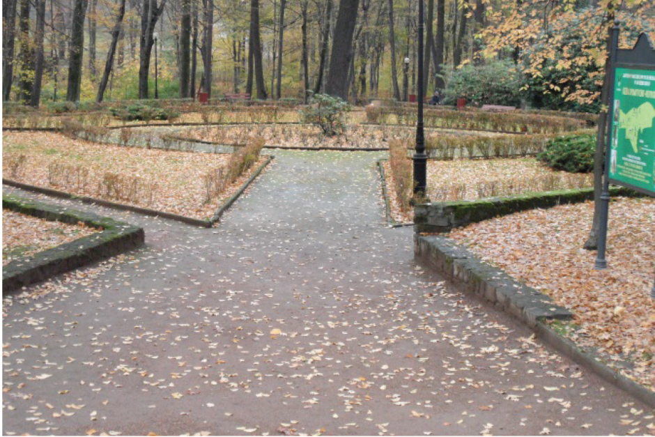
Fotografia 1. Park Zdrojowy im. dr M. Witzaka (1861 r.) z dobrze zorganizowanymi ścieżkami spacerowymi (fot. autorki, listopad 2012)

riałach uzyskanych w gminie, wywiadach środowiskowych oraz informacjach zawartych w wykazanym piśmiennictwie. Zgromadzone informacje potwierdzone zostały dokumentacją fotograficzną.