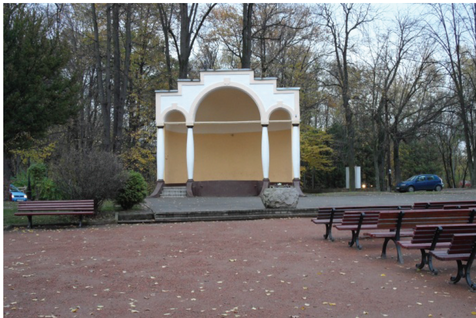
Fotografia 3. Muszla koncertowa w Parku Zdrojowym z 1862 r. amfiteatr, miejsce organizacji imprez muzycznych, m.in. cyklu Muzyczne środy w Jastrzębiu-Zdroju (fot. autorki, listopad 2012)

Photo 3. The Spa Park concert hall from 1862 – an amphitheatre and venue for music events such as the Musical Wednesdays in Jastrzębie-Zdrój cycle (photo by authoress, November 2012)