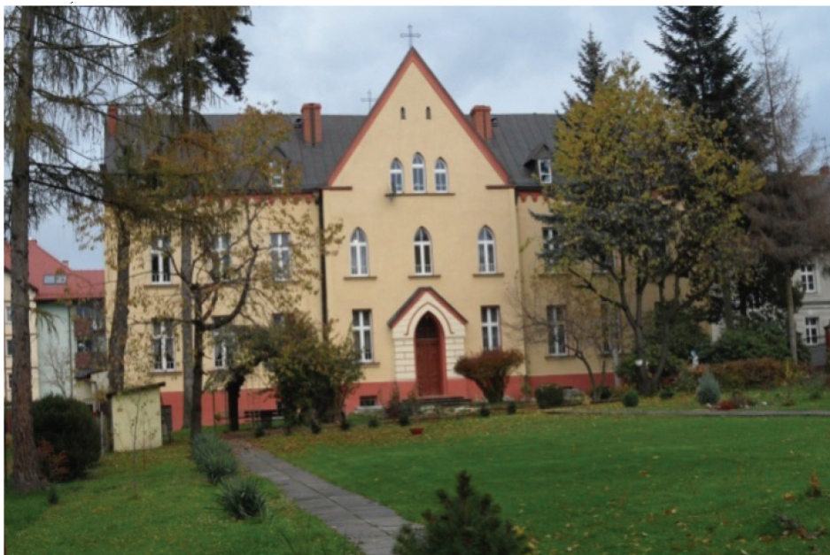
Fotografia 9. Dawny i obecny zespół klasztorny sióstr Boromeuszek z 1891 r. (fot. autorki, listopad 2012 r.)