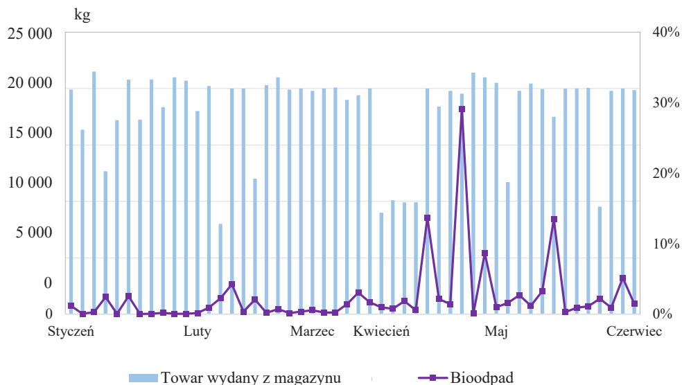
Rysunek 3. Udział bioodpadów w ogólnej ilości przyjętego towaru w trakcie trwania sezonu – śliwka