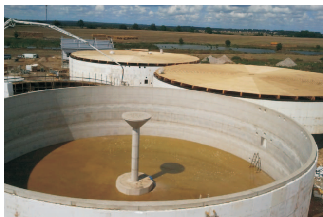
Rys. 2. Betonowe zbiorniki fermentacyjne [30] Fig. 2. Concrete fermentation tanks [30]

Najbardziej popularnym rodzajem zbiorników fermentacyjnych w Europie są zbiorniki żelbetowe. Znajdują one powszechne zastosowanie w biogazowniach w Niemczech, Czechach, Włoszech oraz w Polsce (rys. 2). Najczęściej budowane są z gotowych prefabrykatów, ściągniętych ze sobą stalowymi linami. Ze względu na konstrukcje tego rodzaju zbiorników możliwe jest ich przykrycie zarówno dachowym zbiornikiem membranowym, jak również stropem żelbetowym. W praktyce fermentory żelbetonowe budowane są do wysokości 6-8 m, natomiast ich średnica może osiągać niekiedy ok. 36 m. Niestety takie konstrukcje powodują duże straty ciepła w górnej części zbiornika zimą oraz szybko nagrzewają się w okresie letnim. Wynika to przede wszystkim z niekorzystnego stosunku wysokości do średnicy obiektu oraz dużej powierzchni górnej, najczęściej z ograniczoną ilością izolacji termicznej. Ponadto w przypadku zbiorników żelbetowych możliwa jest ich budowa częściowo lub całkowicie w ziemi.