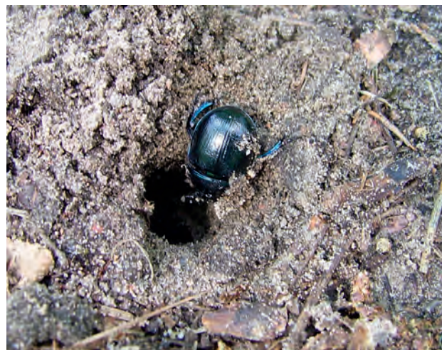
Ryc. 7. Żuk gnojnik przy wlocie do szybu.

tym skrzypiące dźwięki wywołane pocieraniem pokrywy o odwłok. Owadzia para kończy zakopywanie padliny, a następnie przekopuje ukośny, rozgałęziony