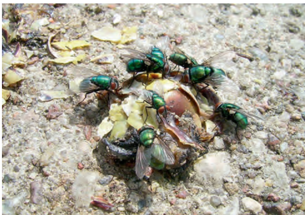
Ryc. 1. Padlinówka cesarska.

ranach zaś plujka pospolita ( Calliphora vicina ), to jeden z najważniejszych dowodów entomologicznych przy dochodzeniach w sprawach morderstw. Na podstawie wielkości jej larw i kolonizacji ciała po śmierci można ustalić dokładny czas zgonu. Larwy Lucilla sericata są hodowane w laboratoriach w warunkach sterylnych i stosowane w leczeniu trudno gojących się ran, również stopy cukrzycowej. Larwy zjadają martwą tkankę i bakterie oczyszczając rany. Czasem samice składają jaja w otwartych ranach zwierząt. Larwy żywią się wówczas martwą, gnijącą tkanką, nie naruszając przy tym zdrowych tkanek. Ich wydzieliną dodatkowo przyspiesza gojenie rany.