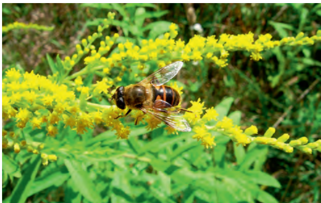
Ryc. 2. Gnojka wytrwała.

Gnojka wytrwała ( Eristalis tenax ) jest podobna do pszczoły, ciemnobrązowa, pokryta szarymi włoskami, z odwłokiem ozdobionym żółtymi plamami (Ryc. 2). Długość ciała owada wynosi 1,5–1,9 cm. Dorosła gnojka żywi się pyłkiem i nektarem kwiatowym. Samice w locie składają jaja do zanieczyszczonych wód i kloacznych dołów, które zapewnią przyszłym