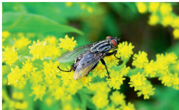
Ryc. 3. Ścierwica mięsówka.

Ścierwica mięsówka ( Sarcophaga carnaria ) to muchówka o długości ciała 1,3–1,5 cm. Posiada szaro-czarną barwę z podłużnymi, ciemnymi smugami na tułowiu, na odwłoku jasno-ciemną szachownicę oraz sterzące szczecinki i piękne brązowo-czerwone oczy (Ryc. 3). Najnowsze badania pokazują, że