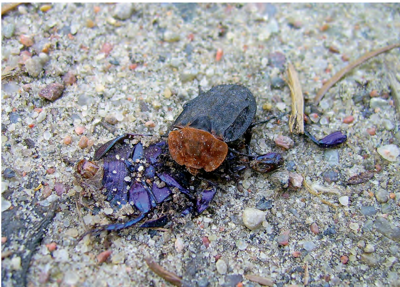
Ryc. 8. Ścierwiec w czasie posiłku.

Nekrofagi i koprofagi obok bakterii i grzybów są niezbędnym końcowym ogniwem wszystkich łańcuchów troficznych. Umożliwiają przetwarzanie szczątków organicznych w nieorganiczną materię dostępną