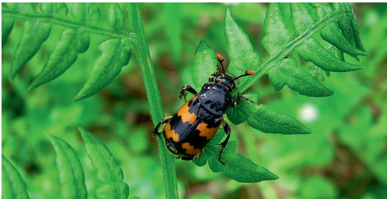
Ryc. 5. Grabarz pospolity.

korytarz, prowadzący z powierzchni ziemi do padliny. W korytarzowych rozgałęzieniach samica składa jaja, z których po kilku dniach wylęgają się larwy. Grabarz pospolity posiada trzy stadia larwalne, w każdym stadium larwa ma odmienny wygląd. Jest