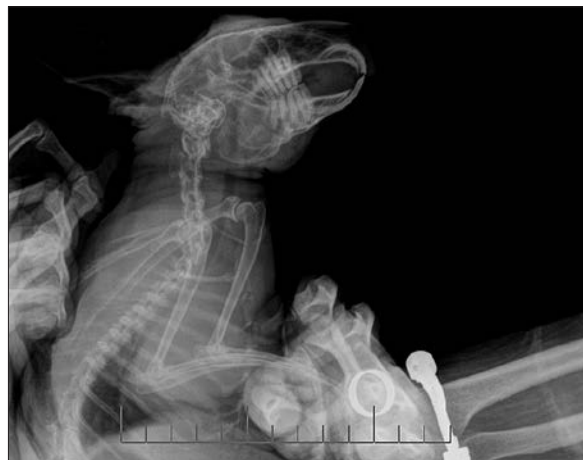
Ryc. 2. Boczna projekcja czaszki dorosłej samicy królika miniaturowego. U zwierzęcia występował izotop