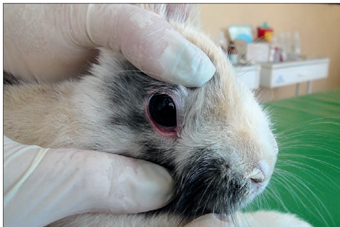
Ryc. 1. Wczesne stadium zapalenia spojówek u królika. Badanie okulistyczne wykazuje zaczerwienienie spojówek