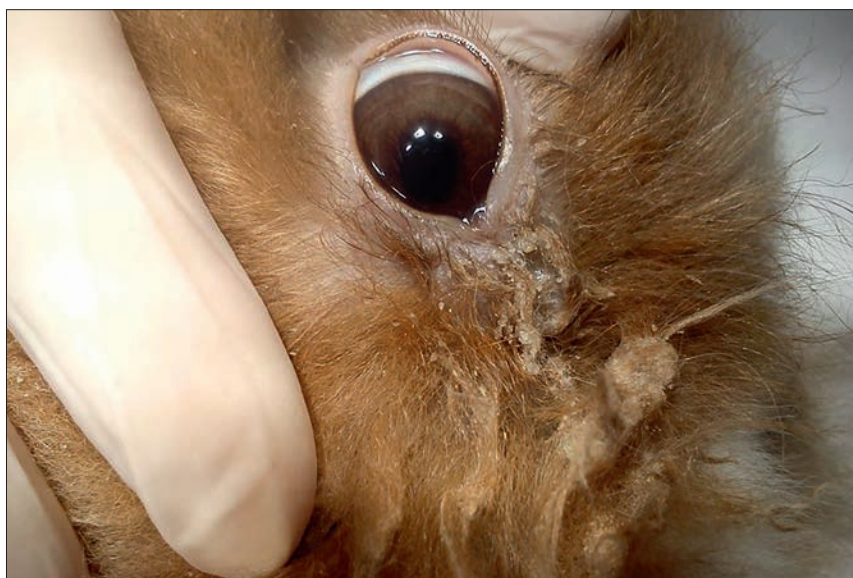
Ryc. 5. Nieustanna produkcja wydzieliny prowadzi do maceracji skóry w okolicy gałki ocznej oraz powstania zmian skórnych z utratą włosów