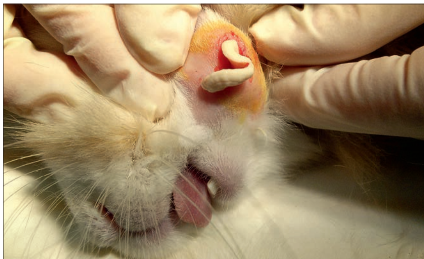
Ryc. 8. Zapalenie worka łzowego spowodowane chorobą uzębienia i ropniem podżuchwowym