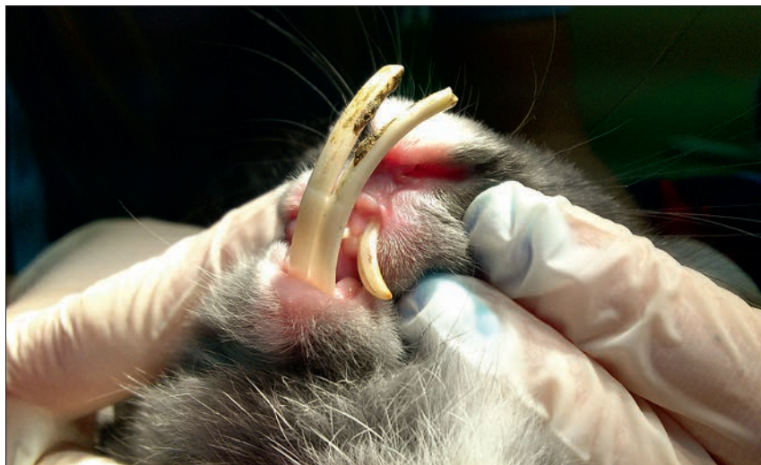
Ryc. 7. Wydłużone zęby sieczne. Jako metodę leczenia zapalenia worka łzowego zaproponowano chirurgiczne usunięcie siekaczy

Podczas badania klinicznego należy przeprowadzić pełne badanie stomatologiczne. Przerost zębów siecznych, przedtrzonowych i trzonowych może prowadzić do zapalenia worka łzowego (2, 3, 5, 9, 12). Stwierdzono również, że wpływ na rozwój choroby może mieć nadczynność przytarczyc wywołana zaburzeniem metabolizmu wapnia i prowadząca do odwapnienia czaszki (9).