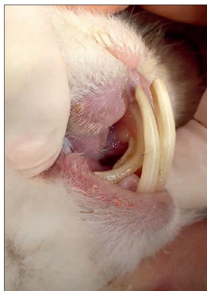
Ryc. 6. Wydłużone korzenie górnych pierwszych zębów siecznych uciskają na przewód nosowo-łzowy i powodują upośledzenie przepływu łez