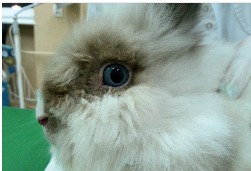
Ryc. 4. Zapalenie spojówek z izotokiem i zabrudzeniem włosów w okolicy oka u królika