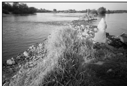
Rysunek 3. Uszkodzenie tamy podłużnej powyżej wlotu do ramienia Figure 3. Damage of longitudinal structure upwards of the side arm

ramiona i otoczenie wyspy zasypane piachem, do rzędnej zbliżonej do poziomu wody średniej rocznej. Jest to rezultatem naturalnego procesu zmian położenia nurtu w nieuregulowanej w dostatecznym stopniu rzece i związanej z tym zmiany miejsca akumulacji oraz erozji.