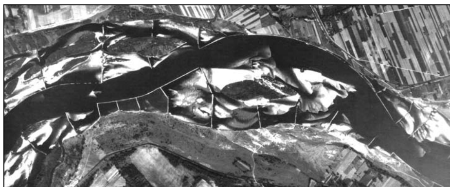
Rysunek 5. Rynna oddzielająca odsypy na brzegu wypukłym Figure 5. Channel separating chute bars on the convex bank

Bardzo często obok, przy brzegu, tworzy się rynna oddzielająca odsypy wokół wysp od brzegu. Podobnie spotyka się częściowe zasypanie ramienia. Jeżeli zasypany jest wylot ramienia, poziom wody powyżej odkładu jest zbliżony do poziomu wody na wlocie. Jeżeli zasypany jest wlot, lustro wody w ramieniu poniżej odkładu znajduje się na poziomie wody w korycie głównym u wylotu z ramienia. Lokalnie lustro wody ma bardzo duży spadek i łatwo tworzy wąską rynnę, wijącą się wśród ławic piasku złożonych w ramieniu przez wysokie wody. Oddzielanie odsypów od brzegu głębszym pasmem wody obserwuje się także w korycie uregulowanym na brzegu wypukłym, przy zamulaniu przestrzeni międzyostrogowej (rys. 5). To samo zjawisko obserwuje się także w opisanych przez Hartmana [2002] rezultatach badań modelowych systemu ostróg, budowanych dla wymuszenia meandrowania renaturyzowanej rzeki.