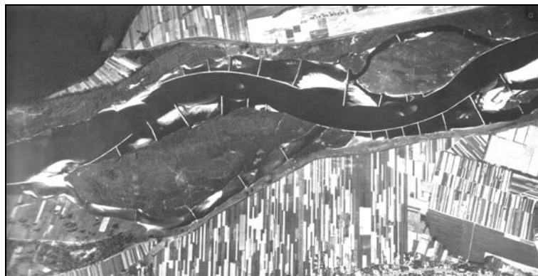
Rysunek 2. Stan ramienia bocznego w 6 lat po zarefutowaniu Figure 2. Situation in the side arm six years after silting

wleczenia przy stanach średnich i niskich. W korycie głównym w dalszym ciągu istnieje tendencja do wypiętrzania dna. Istnienie przetamowań nie powoduje stałego, znaczącego zasypywania bocznych ramion. Obserwuje się tu zjawisko wręcz przeciwne. Z zarefutowanych obszarów, o ile refulisko nie zostało dostatecznie utrwalone, materiał jest w ciągu pierwszych lat po przetamowaniu systematycznie wymywany (rys. 2). W głębokich przetamowanych ramionach, gdzie nie wykonano refulowania, czasami obserwowano częściowe wypływanie, ale w dłuższym okresie proces płukania nie pozwala na zasypianie ramienia i w rezultacie dno rzadko przekracza poziom wody średnio-niskiej. Dodatkowo płukaniu ramion sprzyja przerywanie przetamowań przez wody wysokie. Stosowane dotychczas konstrukcje są zbyt słabe wobec działania czynników niszczących. Najwięcej zniszczeń obserwuje się, w przypadku budowli prostopadłych do kierunku płynięcia wody, na połączeniu korpusu z brzegiem. Wzmocnienia wymaga zarówno konstrukcja skrzydełka, jak i korpus przetamowania.