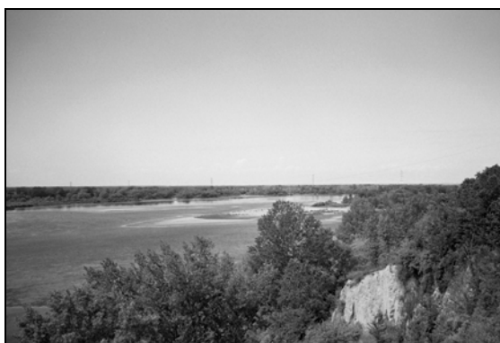
Rysunek 1. Różne stadia rozwoju wyspy Figure 1. Different stages of island evolution

miejscach gromadzi się kra lub śryż, które ograniczając pole przekroju koryta głównego, kierują przepływ do jednego z bocznych ramion, znacznie węższego od koryta głównego. Wymuszone w ten sposób, dużo większe od normalnie występujących, prędkości wody wywołują w ramieniu erozję. Jeżeli wzdłuż ramienia porasta gęsta i wysoka wiklina to wzdłuż „ściany” w okresie wezbrań, powstaje przybrzeżna rynna, dodatkowo pogłębiająca ramię. W wyniku tych zjawisk głębokości dla żeglugi są niejednokrotnie znacznie lepsze w bocznym ramieniu niż w głównym korycie.