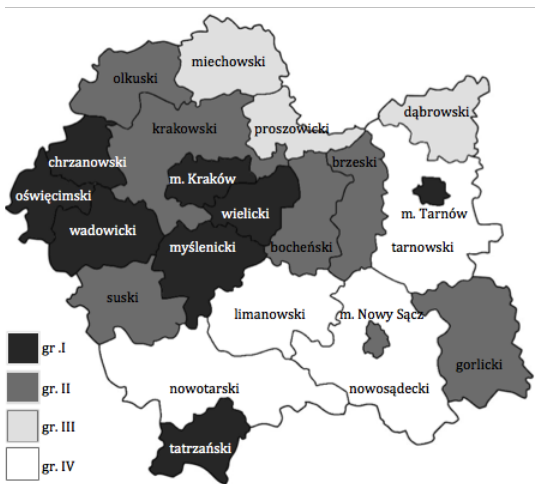
Rysunek 1. Grupy powiatów województwa małopolskiego o podobnej strukturze agrarnej Figure 1. Groups of districts of similar agrarian structure