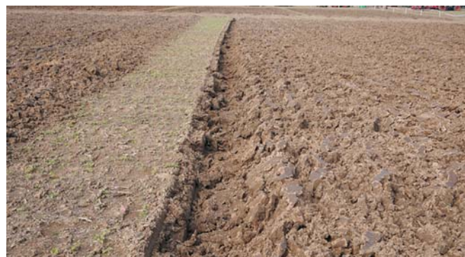
Rys. 6. Bruzda lekko zakrzywiona i zasypana Fig. 6. Slightly curved and buried furrow

w czystości bruzdy. Częste były przypadki oberwanej ścianki bruzdowej i zasypania dna bruzdy. Obrywanie ścianki występowało szczególnie w przypadkach przeciążenia ciągnika i poślizgu kół powodującego koleinę, w której odcinana była ostatnia skiba.