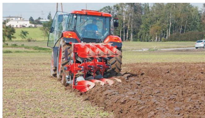
Fig. 2. Ploughing during the competition