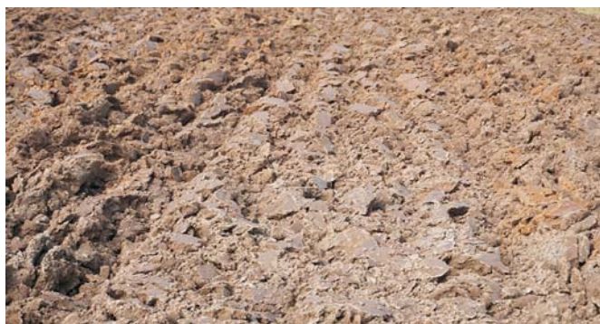
Rys. 7. Skiby dobrze dołożone Fig. 7. The ridges well placed