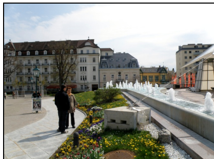
Fotografia 13. Baden bei Wien, widok od strony Parku Zdrojowego na domy uzdrowiskowe (fot. autorki, kwiecień 2010)

Photo 13. Baden bei Wien, view from the Spa Park onto the spa houses (Photo by Authoress, April 2010)