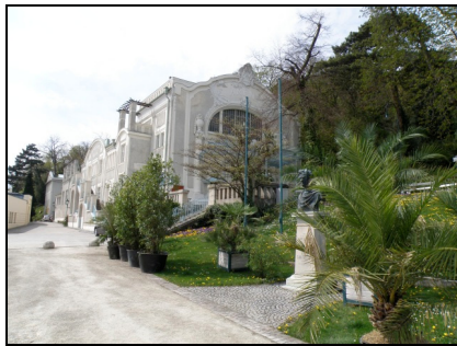
Fotografia 11. Baden bei Wien, Sommerarena (scena letnia) w Parku Zdrojowym (fot. autorki, kwiecień 2010) Photo 11. Baden bei Wien, Sommerarena (Summer Arena) in the Spa Park (Photo by Authoress, April 2010)

które zaspokoić mógł profesjonalny teatr w nowocześnie wybudowanym i urządzonym budynku. W ten sposób wybudowano teatr w Baden. Legitymuje się on prawie 300 letnią tradycją teatralną. Mieści 700 widzów. Od października do marca wystawiane są w nim sztuki teatralne, musicale, operetki. Przez pozostałe miesiące sezonu letniego funkcję tego teatru przejmuje Sommerarena (tłum. scena letnia) w Parku Zdrojowym.