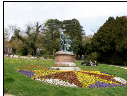
Fotografia 12. Baden bei Wien, pomnik Lannera i Straussa Photo 12. Baden bei Wien, statue of Lanner and Strauss