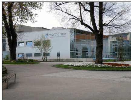
Fotografia 4. Baden bei Wien, Römertherme Baden [Termy Rzymskie] (fot. autorki, kwiecień 2010)

Photo 3. Baden bei Wien, Leopoldsbad [Leopold's Bath] (Photo by Authoress, April 2010)