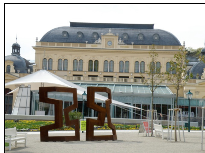
Fotografia 14. Baden bei Wien, elementy małej architektury Parku Zdrojowego (kwiecień 2010)

Photo 13. Baden bei Wien, view from the Spa Park onto the spa houses (April 2010)