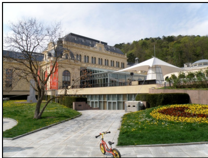
Fotografia 7. Baden bei Wien, Congress Casino Baden [Kongresowe Kasyno Baden] (fot. autorki, kwiecień 2010) Photo 7. Baden bei Wien, the Congress Casino Baden (Photo by Authoress, April 2010)

Na uwagę zasługuje zabudowa miejscowości, jej układ przestrzenny, rodzaje zabudowy, wiek obiektów kubaturowych, poprawnie i niedawno odrestaurowanych. Liczne są budynki w stylu Biedermeier. Wśród uzdrowskiej zabudowy Parku Zdrojowego na plan pierwszy wyłania się budynek Congress Casino Baden. Stanowi on dominantę urbanistyczną, zwłaszcza w tej uzdrowskiej części miasta. Wcześniej budynek ten pełnił funkcję sanatorium, obecnie jest to kasyno gry i centrum konferencyjne. Tu powstały najstarsze łaźienki z wodą termalną „Römerquelle”, tu założono dla cesarzowej Marii Teresy pierwszy park w mieście, na terenie obecnego Parku Zdrojowego – jednego z najpiękniejszych ogrodów historycznych Austrii. Dzięki muzyce podczas letnich koncertów, dzięki atrakcjom oferowanym przez kasyno gry, w tym miejscu, tej szczególnej miejscowości uzdrowskiej odnaleźć można o każdej porze roku wyjątkową atmosferę uzdrowiska Baden, pamiętającą czasy epok minionych.