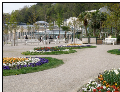
Fotografia 6. Baden bei Wien, widok na Park Zdrojowy - Kurpark (kwiecień 2010)

Photo 5. Baden bei Wien, view onto an alley in the Spa Park - Kurpark (April 2010)