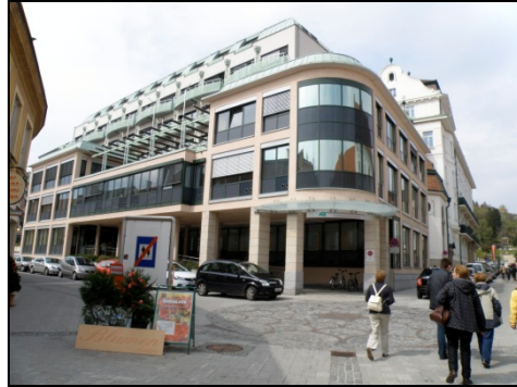
Fotografia 2. Baden bei Wien, nowa zabudowa wydzielonej strefy ruchu pieszego, nieopodal Parku Zdrojowego

Photo 1. Baden bei Wien, the Holy Trinity pillar in the Baden bei Wien centre