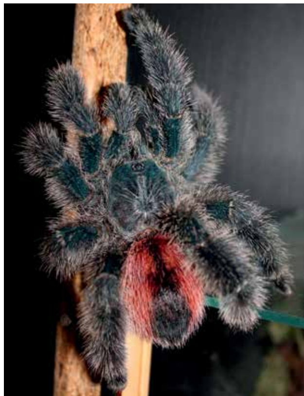
Ryc. 10. Ptasznik zwyczajny ( Avicularia avicularia ) uznawany jest za jednego z najpiękniejszych ptaszników na świecie.

w lasach deszczowych Ameryki Południowej. Innymi dobrze znanymi ptasznikami, zamieszkującymi ten kontynent, są gatunki z rodzaju Psalmopoeus . Pająki te występują w lasach Wenezueli oraz Trynidadu i Tobago. Preferują one środowisko podobne do tego, jakie zamieszkują ptaszniki z rodzaju Avicularia i bardzo dobrze skaczą, co pozwala tym gatunkom polować na owady latające [16]. Z własnego doświadczenia wiemy, że gatunki z tego rodzaju nie sprawiają trudności w hodowli w warunkach domo-