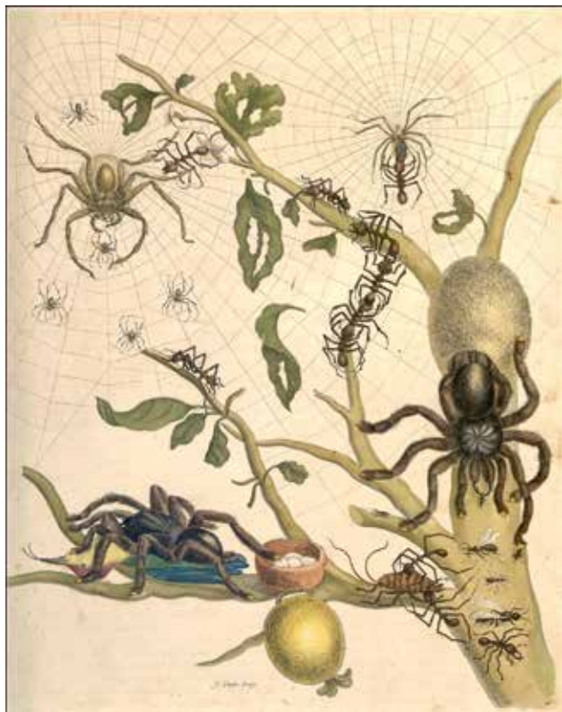
Ryc. 1. Ilustracja przedstawiająca interakcje różnych grup bezkręgowców, w tym ptasznika – Avicularia avicularia ze schwytanym kolibrem (Merian 1705, tablica 18). Skan ilustracji pozyskany dzięki uprzejmości The Göttingen State and University Library (numer katalogowy: GR 2 ZOOL VI, 3904 RARA).

gatunkową można spotkać na obszarach o klimacie tropikalnym i subtropikalnym (Ryc. 2) [11]. Pająki te zamieszkują naszą planetę, zasiedlając możliwie