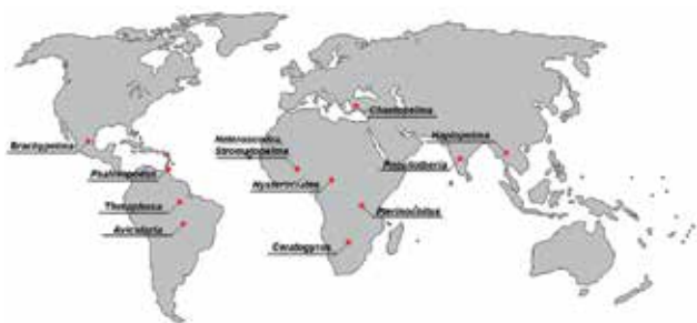
Ryc. 2. Omawiani w niniejszym artykule przedstawiciele ptaszników (Theraphosidae) występują na różnych kontynentach i na różnych szerokościach geograficznych na świecie. Mapa konturowa: http://www.outline-world-map.com/ .

wszystkie naturalne środowiska – od terenów półpustynnych i pustynnych po wilgotne lasy równikowe, z wyłączeniem bagien i łąk zalewowych. Oczywiście dla nas są to zwierzęta egzotyczne, gdyż w naszym kraju ptaszników, poza tymi w hodowlach, nie spotkamy. Podstawowym pożywieniem tych pająków są bezkręgowce, ale ofiarami ptaszników padają również drobne kręgowce (gryzonie, ptaki, gady, płazy) [4].