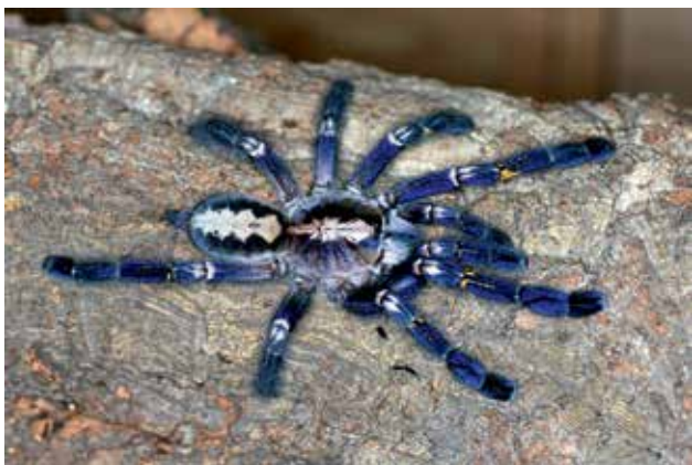
Ryc. 13. Poecilotheria metallica – gatunek krytycznie zagrożony w naturalnym środowisku występowania.

wahają się pierwsze atakować. Niektórzy hodowcy są w stanie wydać sporo oszczędności, żeby spełnić swoje marzenie, którym jest posiadanie Poecilotheria metallica . Ten pięknie ubarwiony ptasznik posiada biały ornament na głowotułowiu i odwłoku oraz niebieskie tło z pomarańczowymi akcentami barwnymi na odnóżach (Ryc. 13). Silny temperament i niecodzienny wygląd często przemawiają za wyborem gatunków z tego rodzaju przez hodowców na swoich pupili. Pają-