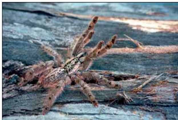
Ryc. 8. Ptasznik śnieżny ( Heteroscodra maculata ) świetnie porusza się po korze drzew.

sób bardzo spektakularny, poprzez skok i schwytywanie ofiary w powietrzu, ale na tym nie koniec. Niektóre ptaszniki, w tym ptasznik wiosłonogi, mają zdolność do lotu ślizgowego, czyli skoku, który polega na takim ułożeniu ciała, aby lecący osobnik mógł bezpiecznie poszybować w dół, przemieszczając się na pewną odległość. Oba gatunki można śmiało uznać za bardzo agresywne i szybkie, które z pewnością nie powinny znaleźć się w terrarium początkującego