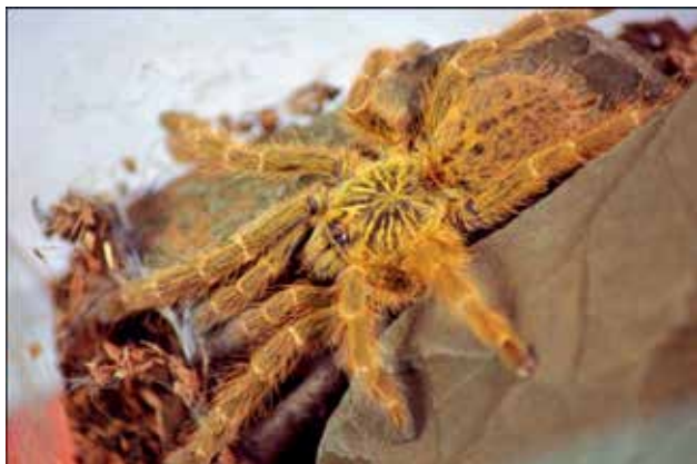
Ryc. 6. Ptasznik słoneczny ( Pterinochilus murinus ) w odmianie barwnej usambara (UMF).

problemów. Z doświadczenia wiemy, że uchylenie pokrywy terrarium na kilka sekund może skończyć się spektakularną ucieczką pająka, którego później nie jest łatwo złapać. Gatunek ten zaciekle broni swej prywatności i jest w stanie kąsać wszystko, co pojawi się na jego drodze. Pająk ten jest interesujący nie tylko z powodu agresywnego temperamentu. Fascynujące są również jego formy barwne: TCF (Typical Colour Form), UMF (Usambara Mountain Variant), DCF (Dark Colour Form), RCF (Red Colour Form). Spotykane są różne warianty kolorystyczne o barwach przechodzących od koloru beżowego (TCF) aż do odmiany ognisto-czerwonej (RCF). Odmiana UMF występuje jedynie w Górach Usambara w Tanzanii i charakteryzuje się połączeniem barw TFC i RCF (Ryc. 6). Gatunki należące do tego rodzaju posiadają także zdolność strydulacji, co demonstrują w warunkach stresu [9].