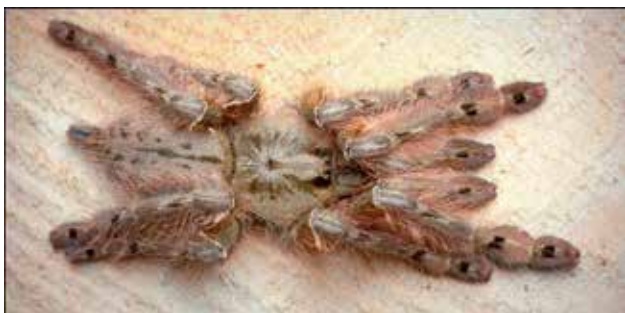
Ryc. 9. Ptasznik wiosłonogi ( Stromatopelma calceatum ) tworzy gniazda w koronach drzew lasów tropikalnych.

hodowcy. Ptasznika wiosłonogiego można spotkać w Sierra Leone, a ptasznik śnieżny występuje w lasach Togo i Kamerunu.