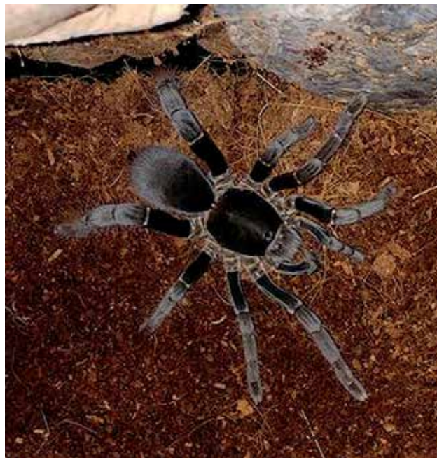
Ryc. 7. Hysteroocrates gigas , którego hodowlane formy są często hybridami, charakteryzuje się masywniejszymi odnóżami IV pary.

Oba gatunki dysponują bardzo silnym jadem i występują w podobnym środowisku. Są to ptaszniki nadrzewne i zamieszkują dziuple lub inne zaciemnione miejsca, które są dogodnie do zbudowania gniazda [14], [15]. Pająki te polują głównie na owady, potrafią upolować także, co jest niezwykle pośród ptaszników, owady latające (!). A jak to robią? Otóż w spo-