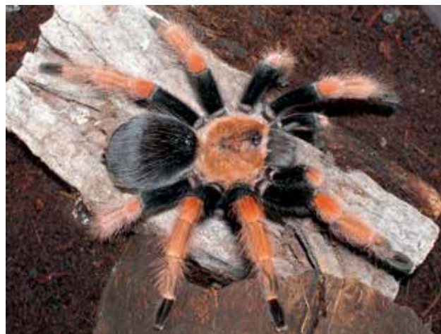
Ryc. 11. Ptasznik czerwono-nogi ( Brachypelma boehmei ) zamieszkuje meksykańskie dżungle. Odwłok tych pająków pokrywa parzące włoski, które są wytrzępywane podczas reakcji obronnej.

znanych jest 14 gatunków, spośród których P. rajaei został opisany stosunkowo niedawno – w 2012 r. Te