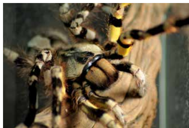
Ryc. 12. Szybki, agresywny i silnie jadowity ptasznik królewski ( Poecilotheria regalis ).

bardzo szybkie i jadowite pająki są bardzo chętnie hodowane na całym świecie. Charakteryzują się bardzo interesującymi wzorami barwnymi. Na spodzie odnóży zazwyczaj dominują barwy jaskrawożółte lub pomarańczowe. Górna część ciała pokryta jest ornamentem, którego barwa jest zmienna i przechodzi od koloru białoczarne przez oliwkowy do niebieskie-