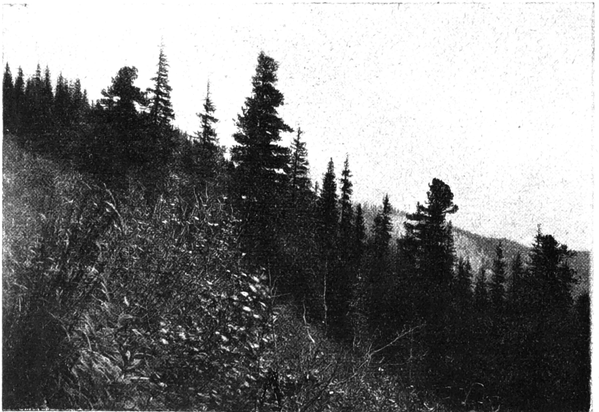
Ryc. 3. Limby na stoku Sywuli.

4. Na zboczach północnych i północno-wschodnich Ithrowyszcza, nad potokiem Kuźmieniec wielki, rośnie dużo limby zarówno wśród kosodrzewiny jak i w reglu górnym. W dwóch miejscach zaznacza się w drzewostanach równorzędny udział, a nawet lekka przewaga limby nad świerkiem o stopniu pomieszania 0·5—0·6. Obfity miejscami młodnik limbowy świadczy o pomyślnych warunkach dla od-