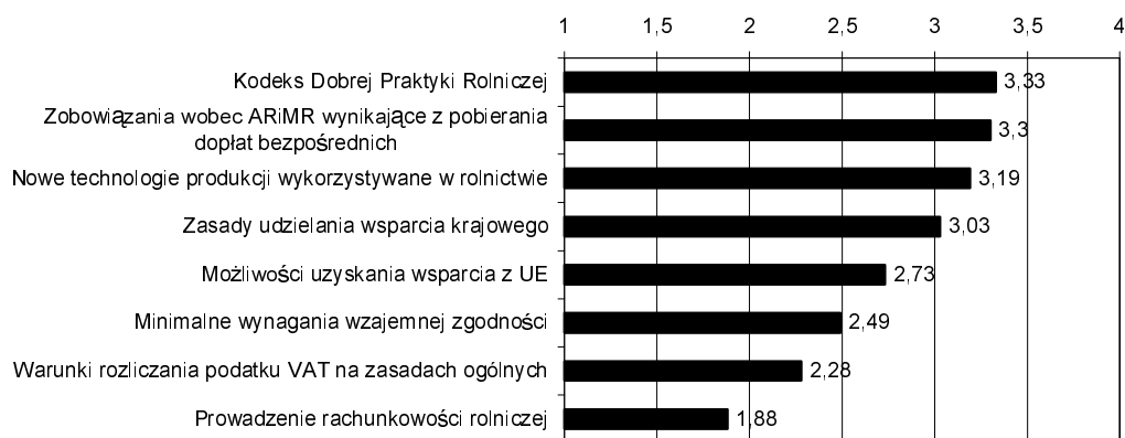
Rysunek 1. Poziom wiedzy fachowej badanych rolników

W badaniach poszukiwano odpowiedzi na pytanie, z których źródeł informacji rolnicy korzystają najczęściej. Odpowiedź na to pytanie zamieszczono na rysunku 2. Z przeprowadzonych badań wynika, że największym zainteresowaniem producentów rolnych cieszyły się programy telewizyjne, na drugim miejscu porady doradców odr, a na trzecim – informacje zamieszczone w