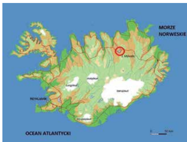
Ryc. 1. Islandia z zaznaczonym Jeziorem Mývatn.

Jeziro Mývatn to jedyny w swoim rodzaju cud Natury, położony na obszarze, gdzie stykają się płyty kontynentalne: euroazjatycka z północnoamerykańską (Ryc. 1). Zjawisko oddalania się wspomnianych płyt od siebie (około 2 cm na rok) przebiega głównie na dnie oceanu, a jedynie na Islandii tę ewolucję skorupy ziemskiej widać na powierzchni. Mývatn to płytkie jezioro, z 50 wyspami (Ryc. 2), które powstało około 2300 lat temu po dużej erupcji wulkanu. Tyle nauka, a wierzenia? Według legendy jezioro to jest wynikiem całkiem prozaicznych uczuć (zazdrości) Diabła. Gdy w czasie procesu twórczego Boga zobaczył Słońce, ze złości, ze względu na jego urodę, chciał je zniszczyć. Pomyślał, że najprościej będzie na nie nasiusiać, aby je zgasić. Ale siusiąc nie trafił i z tego, co spadło na ziemię, powstało jezioro [4].