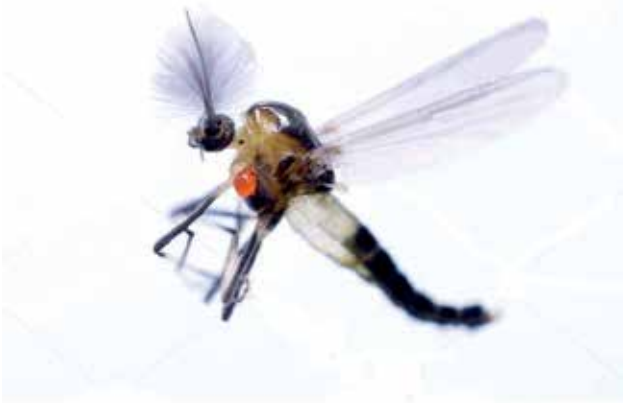
Ryc. 4. Samiec Tanytarsus gracilentus .

A co dalej się dzieje z tak wysoką biomasą Tanytarsus ? Zarówno larwy zasiedlające dno i martwe osobniki dorosłe już po reprodukcji, zalegające na powierzchni