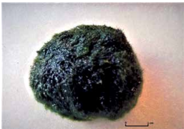
Ryc. 3. Kulista gałęzatką Aegagropila linnaei „lake balls” o średnicy 5 cm.

falowania wody (Ryc. 3). Już ich średnica wzbudza zainteresowanie (około 12 cm); oszacowano, że jest tych kul w Jeziorze Mývatn około 20 mln [5]. Jeżeli dodać do tego specyficzne warunki środowiskowe, takie jak zaopatrywanie w biogeny ze źródeł geotermalnych oraz wysoka temperatura wody, która nie pozwala na jego zamrożenie mimo, że leży blisko koła podbiegunowego, to otrzymujemy odpowiedź