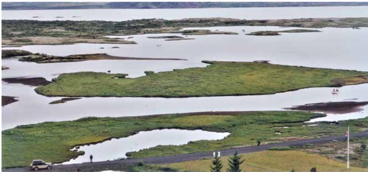
Ryc. 2. Wulkaniczne Jezioro Mývatn (Islandia) w sierpniu.

grupy organizmów; pierwsza z nich to skąposzczety ( Oligochaeta ), dla których gałęzatkę są schronieniem, a które w zamian czyszczą je z osadów. Jest to zdaniem ekologów [3] przykład komensalizmu. Inna liczna grupa to muchówki z rodziny Chironomidae