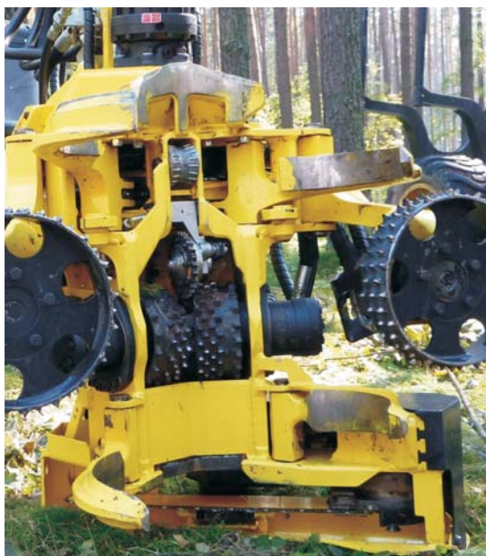
Rys. 2. Głowica typu 2WD firmy Logset [9] i 4WD firmy John Deere z dodatkowymi rolkami prowadzącymi odpowiednio w dolnej i górnej części ramy Fig. 2. 2WD in the Logset head [9] and 4WD in the John Deere with additional guide rollers, respectively in the upper and lower frame parts

Podczas pracy głowicy, bez względu na liczbę zastosowanych rolek, wprawiony w ruch materiał ma mniejszy lub większy bezpośredni kontakt z jej ramą nośną. Dlatego musi być ona tak przestrzennie ukształtowana, aby strzała poruszała się tylko po specjalnie zaprojektowanych do tego elementach. Są one wykonane ze stali odpornej na ścieranie oraz mają płaskie i gładkie powierzchnie stykające się z drewnem, co ogranicza do minimum opory związane z tarcieniem. Ponadto wymiary, jak i zakresy zmian położenia ruchomych elementów roboczych głowicy, nie mogą być przyczyną żadnych ograniczeń w swobodnym posuwie strzały, także podczas zmiany kierunku ruchu. Problemy takie występują rzadziej podczas pracy głowicy w stronę wierzchołka, ponieważ opory robocze najczęściej maleją w miarę jak strzała staje się cieńsza. Pojawiają się one natomiast niekiedy w sytuacji przeciwnej, kiedy grubość strzały stopniowo rośnie i zwiększa się zapotrzebowanie na energię niezbędną do utrzymania odpowiedniej prędkości jej ruchu.