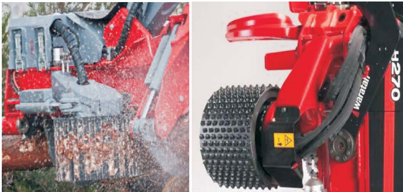
Rys. 3. Rolki na wahaczach pracujących w płaszczyźnie równoległej do osi strzały w głowicy Log Max 6000 [8] oraz Waratah H270 [10]