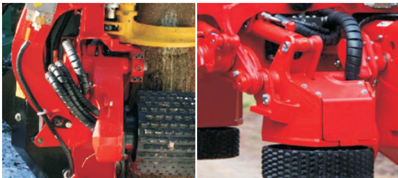
Rys. 4. Zawieszenie z korekcją ustawienia rolek na wahaczu o ruchu równoległym głowicy SP 451 LF [11] i ruchu prostopadłym głowicy Waratah HTH618C [10]