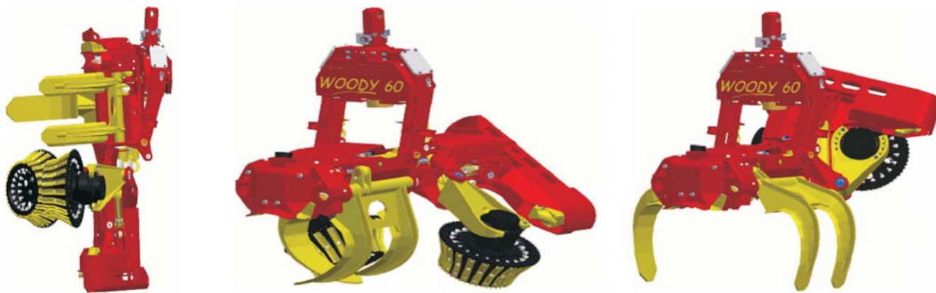
Rys.1. Głowica Woody firmy Konrad w pozycji ścinania, okrzesywania i manipulacji [7] Fig. 1. Konrad Woody head positions: cutting, declimbing and manipulation [7]

Zespół napędowy głowicy harwestera zbudowany jest z co najmniej dwóch rolek oraz silników hydraulicznych (typ 2WD) zamontowanych do ramy głównej w sposób, który zapewnia płynną zmianę położenia względem pozyskiwanego drewna. Stosowane są także układy zbudowane z trzech oraz czterech rolek napędowych (typ 3WD i 4 WD), przy czym w takich rozwiązaniach zarówno dodatkowa trzecia jak i czwarta rolka są montowane do ramy w stałym położeniu. W niektórych głowicach stosowane są ponadto dodatkowe beznapędowe rolki prowadzące (rys. 2), których zadaniem jest zapewnienie bardziej płynnego ruchu pozyskiwanego sortymentu drewna. Rozwiązanie takie zmniejsza opory związane z jego tarciem o głowicę, co ogranicza poślizg zespołu napędowego oraz zapewnia szybszy posuw materiału. W konsekwencji możliwe jest obniżenie ciśnienia oleju w układzie hydraulicznym oraz zużycia paliwa, a także ograniczenie zjawiska szarpania drewnem prowadzącego do przeciążeń zespołów roboczych głowicy.