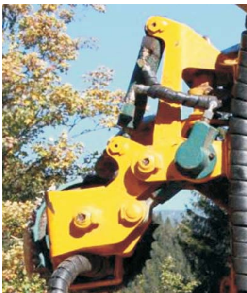
Rys. 5. Układ zawieszenia rolek w głowicy CTL 40 HW przeznaczony do drzew liściastych [6] Fig. 5. The suspension system of rollers in the head CTL 40 HW for deciduous trees [6]