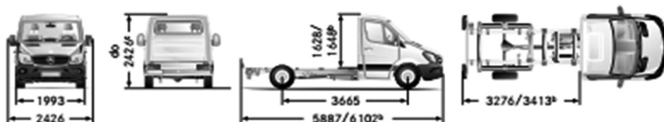
Rysunek 2. Wymiary samochodu mercedes sprinter, typ podwozie do zabudowy z rozstawem osi 3665 mm

Na początku warto pamiętać o tym, iż większość kurierów to kierowcy z kategorią B, która pozwala prowadzić pojazd mechaniczny o dopuszczalnej masie całkowitej do 3,5 t. Posiłkując się wybranymi danymi technicznymi z tabeli 2, przyjęto masę (wraz z uwzględnieniem masy domontowanego zawieszenia pneumatycznego) około 1790 kg. Nadwozie wymienne musi mieć zdecydowanie mniejsze wymiary niż te używane obecnie w przewozach kombinowanych, najlepiej przybliżone do samochodu typu furgon. Biorąc całkowitą masę mercedesa sprinter typu furgon w wersji standard (z dachem wysokim o takim samym rozstawie osi 3665 mm jak typ do zabudowy), która wynosi 2100 kg. Nadwozie wymienne powinno zatem mieć masę około 310 kg. Masa całkowita ładunków nie mogłaby przy takich założeniach przekroczyć 1400 kg. Jako że jest to pewnego rodzaju model teoretyczny, przy dokładnym projektowaniu wyniki te mogą być o wiele różne ze względu na rodzaj materiałów. Z tego powodu w koncepcji przyjęto margines dodatkowych 200–300 kg, co spowodowało, że założona całkowita masa ładunków będzie w granicach 1100–1400 kg. Jako że kurierzy przewożą zazwyczaj lekkie ładunki, jest to optymalna ładowność. Na rysunku 2 przedstawiony jest typ podwozia do zabudowy wraz z podstawowymi wymiarami, aby zobrazować koncepcję pojazdu. W dalszej części artykułu dane te posłużą do zwymiarowania zaproponowanego modelu nadwozia wymiennego.