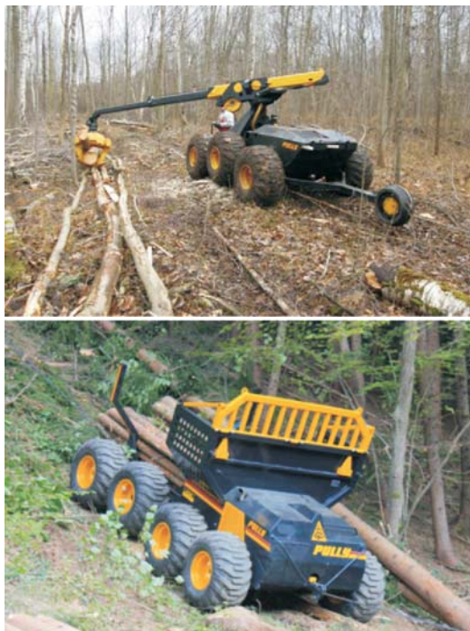
Rys. 2. Pojazd Pully z nadwoziem kłonicowym (z lewej) i chwytakiem zrywkowym (z prawej) [13]

klembanka, która jest uzębiona w celu lepszej stabilizacji ładunku. Kleszcze klembanka wyposażane są w linowy mechanizm zaciskający odziomki. Jest przeznaczony zarówno do pracy na stokach, jak i w terenie płaskim, gdzie ważna jest niska kompensacja podłoża. Dzięki wszystkim skrętnym kołom (niezależnie parami) pojazd ten ma możliwość jazdy w bok (na ukos) i poruszania się również bez liny prowadzącej. Pojazd można rozbudować o chwytak zrywkowy, w którym chwytak kleszczowy podwieszany jest do teleskopowego żurawia hydraulicznego (zakres obrotu żurawia 330°) o zasięgu do 6 m. W opcji jest także dodatkowa wciągarka linowa o sile uciągu 4 t, z liną o \varnothing 12 lub \varnothing 14 mm i długości 80 m.