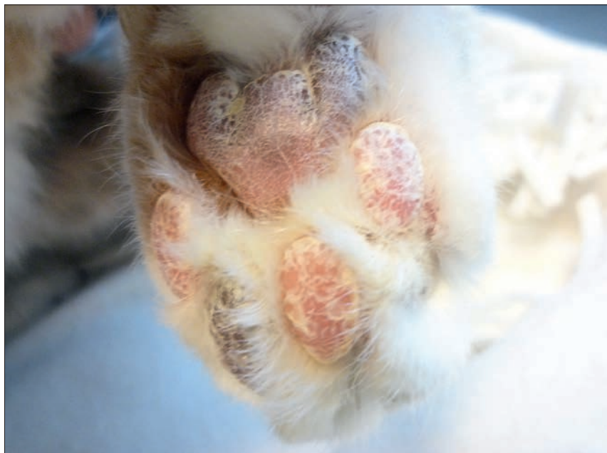
Ryc. 3. Nadmierne rogowacenie na opuszkach kończyn u kota z grasiczakiem i towarzyszącym mu skórny zespół paranowotworowy

przypadku występowało nadmierne rogowacenie (ryc. 3; 8). Spośród innych objawów u kotów z grasiczakiem stwierdzano wypływ z nosa i worków spojówkowych, zapalenie spojówek, zapalenie jamy ustnej oraz powiększenie węzłów chłonnych żuchwowych (8, 26, 28). U kotów z grasiczakiem oprócz złuszczającego zapalenia skóry występować może również nużliwość mięśni (miastenia) wraz z przetykiem olbrzymim. Ten zespół paranowotworowy obserwowany jest jednak częściej u psów z grasiczakiem (29, 30, 31). U kotów z grasiczakiem w przypadku niewystąpienia zespołu paranowotworowego objawy kliniczne wynikają głównie z obecności rosnącego w śródpiersiu guza. Należą do nich duszność i kaszel. Ponadto, w przypadku guzów osiągających znaczne rozmiary dochodzi do ucisku na naczynia krwionośne i limfatyczne, powodując upośledzenie odpływu krwi i chłonki z głowy, szyi i kończyn piersiowych, co objawia się ich obrzękiem oraz pogrubieniem i uwidocznieniem żył szyjnych zewnętrznych. Objawy te (zespół żyły głównej doczaszkowej) opisywano u psów z grasiczakami (1, 7, 29, 32, 33). Z kolei objawy, takie jak nadmierne ślinienie się czy regurgitacja mogą wynikać zarówno z ucisku na przełyk, jak i nużliwości mięśni (33). Powikłaniem choroby może być zachłystowe zapalenie płuc (33).