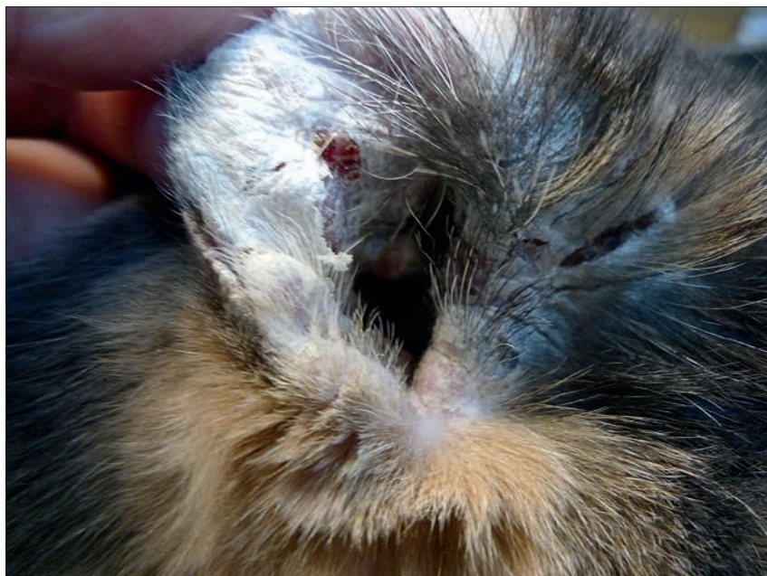
Ryc. 2. Znaczne oddzielenie się ulegającego martwicy naskórka na wewnętrznej stronie małżowiny usznej u kota z grasiczakiem i towarzyszącym mu skórny zespół paranowotworowym

rumień oraz złuszczenie naskórka na głowie i małżowinach usznych. Świąd nie występuje (25). Stan ogólny zwierzęcia na tym etapie choroby jest dobry. Z czasem zmiany skórne ulegają nasileniu i uogólnieniu. Skóra jest silnie zaczerwieniona, następuje masowe złuszczenie naskórka i pojawiają się wyłysienia (ryc. 2). Mogą również pojawić się owrzodzenia. Pomiędzy palcami, pod pazurami i w przewodach słuchowych gromadzi się ciemnobrązowa substancja przypominająca woszczyne (15). Zwierzęta na tym etapie choroby mogą mieć podwyższoną temperaturę ciała, są apatyczne, przestają przyjmować pokarm, wykazują niechęć do ruchu, masa ciała