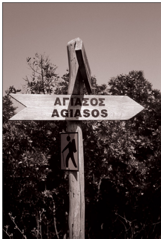
Fot. 1. Nowe oznakowanie szlaku turystycznego prowadzącego z Agiassos na szczyt Olimpu Phot. 1. New marking of the trail leading from Agiassos to the summit of Mt Olympus

(„sun, sea, sand”), turystyka aktywna (oparta o walory środowiskowe i potencjalną bazę obiektów sportowych) czy turystyka kulturowa, której bazę stanowią zasoby kultury materialnej wyspy (Nijkamp, Verdonkschot 1992). Obecnie stwierdzić można, że najlepiej rozwinęły się w badanym obszarze formy masowej turystyki wypoczynkowej oraz specyficzna, lokalna agroturystyka (Papanastasiou et al. 2006, Kizos, Iosifides 2007), jednakże peryferyjne położenie wyspy względem reszty kraju sprawia, że jest ona odwiedzana przez relatywnie niedużą liczbę turystów.