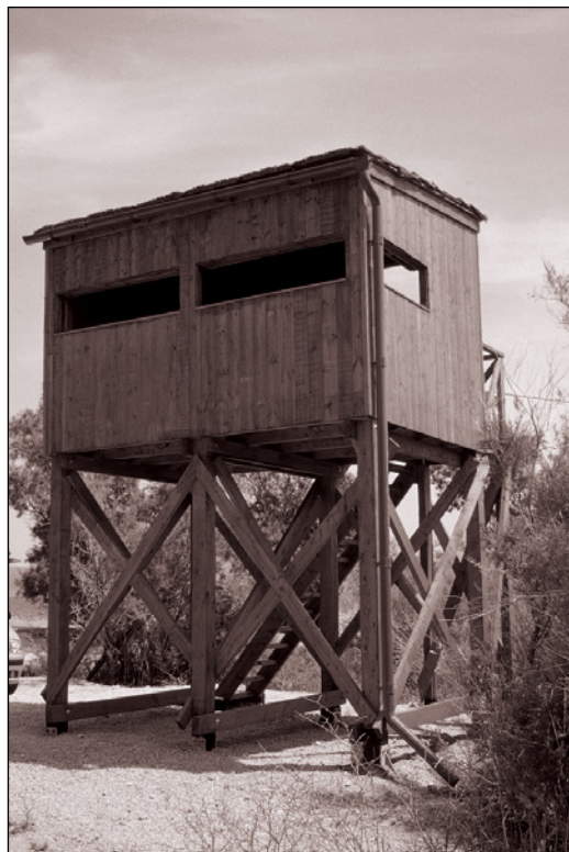
Fot. 2. Wieża do obserwacji ptaków nad słonym mokradłem w okolicy miejscowości Parakila Phot. 2. Bird-watching tower on the salty marshes near the village Parakila

W efekcie władze lokalne postanowiły nadal rozwijać te aspekty gospodarki turystycznej, które wspomagałyby rozwój turystyki aktywnej. Trwały ślad tych działań widoczny jest w rozbudowie infrastruktury turystycznej w oparciu o dotacje z Unii Europejskiej. Przykładowo w pierwszej dekadzie XXI w. rozbudowano i oznakowano na wyspie szlaki turystyczne w obszarach górskich (fot. 1), podkreślono znaczenie „birdwatchingu” poprzez budowę nowoczesnej infrastruktury ułatwiającej obserwację ptaków w rejonie przybrzeżnych salin, m.in. parkingów dla samochodów, tablic informacyjnych, wież obserwacyjnych (fot. 2), a na całej wyspie wprowadzono jednolity system oznaczeń ułatwiających dotarcie do – zarówno bardziej, jak i mniej rozpoznawalnych – atrakcji turystycznych. Pewne nakłady finansowe przeznaczono też na rewitalizację zdewastowanych obiektów kulturowych (m.in. Muzeum Ouzo w Agia Paraskevi, stary młyn w Milelia) i promocję wybranych atrakcji turystycznych.