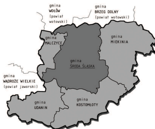
Ryc. 2. Położenie w skali powiatu średzkiego Fig. 2. Location in Środa Śląska district