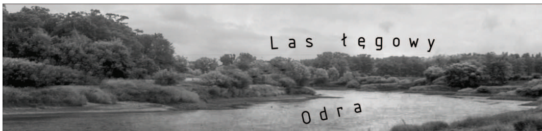
Ryc. 3. Krajobraz doliny Odry w okolicy miejscowości Rzeczyca Fig. 3. Landscape of Odra valley near Rzeczyca

Położenie w obrębie dwóch krain geograficznych powoduje, że północna i południowa część gminy Środa Śląska są odmienne pod względem krajobrazowym. Pradolina Wrocławska (północna część gminy) obejmuje dolinę Odry oraz dolne odcinki jej dopływów. Wzdłuż koryta rzeki występują zwarte kompleksy lasów łęgowych – głównie łągi jesionowo – wiązowe oraz podmokłe łąki o wysokich walorach ekologicznych i krajobrazowych (ryc. 3). Ponadto znajdują się tu atrakcyjne starorzecza ze zbiornikami wodnymi i bagienami. Obszar wzdłuż doliny Odry to jeden z najważniejszych korytarzy ekologicznych w Europie Środkowej – jest częścią Krajowej Sieci Ekologicznej ECONET – PL oraz objęty ochroną jako obszar Natura 2000 pod nazwą „Łęgi Odrzańskie”. Tą część gminy cechuje niewielkie nasycenie obiektami zabytkowymi.