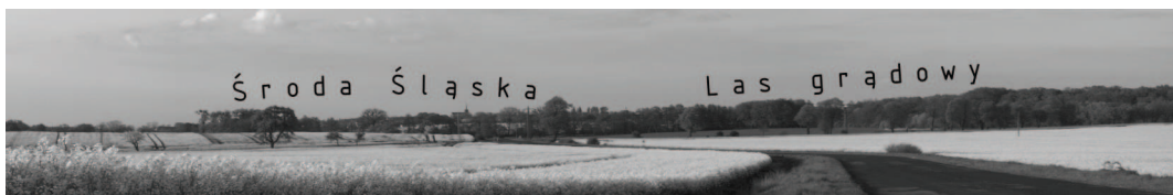
Ryc. 4. Krajobraz rolniczy w pobliżu Chwalimierza – południowa część gminy Fig. 4. Agricultural landscape near Chwalimierz – southern part of commune

Do niedawna w południowej części gminy przeważał krajobraz rolniczy urozmaicony zadrzewieniami śródpolnymi i niewielkimi pagórkami o łagodnych zboczach (ryc. 4). Większe kompleksy leśne występują tu tylko w pobliżu Chwalimierza. Charakterystyczna dla tej części gminy jest duża liczba zabytków architektury. W wielu miejscowościach znajduje się dominujący w krajobrazie kościół. Powszechnie występują też założenia dworskie i pałacowo – parkowe. Największa liczba obiektów historycznych znajduje się w Środzie Śląskiej. Rozmiar zrealizowanych przedsięwzięć inwestycyjnych sprawił, że krajobraz uległ znaczącym zmianom. W bezpośrednim sąsiedztwie miasta znajduje się podstrefa Legnickiej Specjalnej Strefy Ekonomicznej, gdzie zlokalizowano wiele nowych zakładów produkcyjnych [Lentner, 2008].