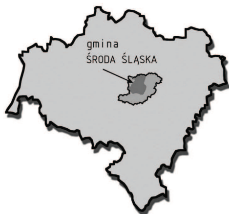
Ryc. 1. Położenie w skali woj. dolnośląskiego Fig. 1. Location in Lower – Silesian Province

Gmina Środa Śląska jest położona w centralnej części województwa dolnośląskiego (ryc. 1), w powiecie średzkim (ryc. 2). Głównym centrum życia społeczno – gospodarczego i kulturalnego jest Środa Śląska, leżąca na starym szlaku handlowym. Łączył on Wrocław z Legnicą i prowadził dalej na zachód przez Zgorzelec do Niemiec. Położenie dokładnie w połowie drogi pomiędzy dwoma dużymi ośrodkami - Wrocławiem i Legnicą, prawdopodobnie było przyczyną powstania nazwy miasta. Z czasem pierwotną nazwę Środa wyparło określenie Nowy Targ (niem. Neumarkt) funkcjonujące do końca II wojny światowej.