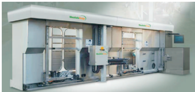
Rys. 2. Robot udojowy T!TAN produkcji WestfaliaSurge GmbH, Niemcy