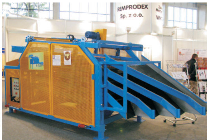
Rys. 1. Sortownik do ziemniaków JKS 220/5S produkcji REMPRODEX Sp. z o.o., Człuchów