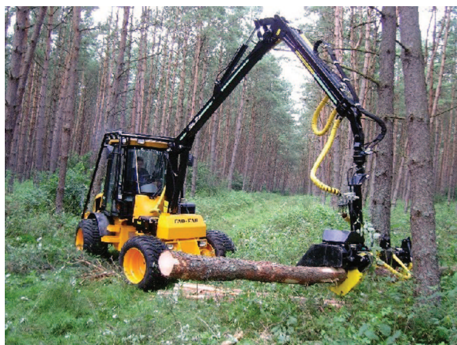
Rys. 3. Miniharvester FAO-FAR

Trzecią z nagrodzonych maszyn jest miniharvester zaprezentowany przez firmę Fao-Far (rys. 3). Ciągnikiem bazowym jest ładowarka czołowa wyposażona w żuraw hydrauliczny o udźwigu (przy maksymalnym wysięgu) min. 400 kg. Na żurawiu zawieszona jest głowica harvesterowa. Głowica w systemie „Arbro” pozwala na agregatowanie jej z innymi nośnikami, np. ładowarką leśną, koparką lub ciągnikiem rolniczym. Miniharvester FAO-Far jest maszyną niewielkich rozmiarów przeznaczoną głównie do prac w gęstych drzewostanach trzebieżowych. Głowice pozwalają na ścinanie drzew o średnicy w miejscu cięcia do 40 cm. Okrzesywanie odbywa się poprzez posuwisto-zwrotny ruch części głowicy z ramionami trzymającymi drzewo i przeciąganie go przez noże stałe. Skok siłownika wynosi 75 cm. Cięcie drewna wykonywane jest przez piłę łańcuchową poruszającą się po 16-calowej prowadnicy. Układ hydrauliczny napędzający ruchome części głowicy ma wydajność do 90 l/min oraz ciśnienie robocze do 200 bar. Sterowanie głowicą poprzez układ elektroniczny odbywa się z kabiny za pomocą manetki. Podobnie jak w wyższej klasy harvesterach, „Arbro” posiada system pomiarowy z dostępnymi wieloma programami optymalizującymi przerzynkę drewna według średnic czy długości sortymentów.