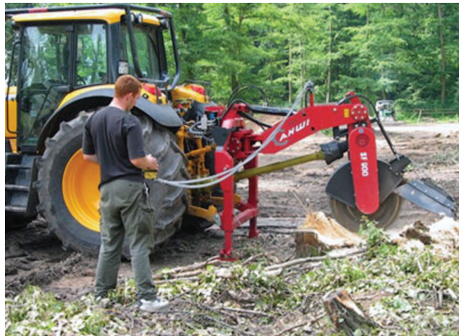
Rys. 5. Frez do pniaków AHWISF 900

cznie i wzdłużnie do osi ciągnika. Zakres szerokości roboczej dochodzi do 2660 mm, a przemieszczanie wzdłuż osi 2100 mm.