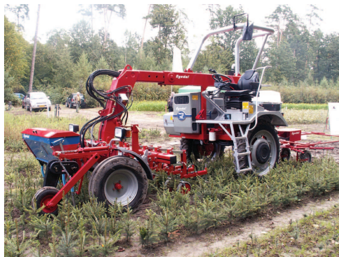
Rys. 4. Nośnik maszyn i narzędzi szkółkarskich EGEDAL

skrzynię przekładniową, natomiast na dodatkowe wałki na osi przedniej za pomocą przekładni hydrostatycznych. Aby zapewnić uniwersalność nośnika i mocowanie między osiami szerokich i długich narzędzi roboczych rama nośnika ma możliwość zmiany długości, przez co zwiększa się rozstaw między osiami przednią i tylną. Istnieje też trzystopniowa regulacja rozstawu kół w zakresie 1500 - 1800 - 2050 mm. Prześwit nośnika wynosi 800 mm, co umożliwia pracę przy produkcji kilkuletniego materiału sadzeniowego. Konstrukcja nośnika umożliwiła zamocowanie trzech różnych narzędzi i równoczesne wykonywanie kilku zabiegów, np. z przodu wał gładki ugniatający glebę przed siewem, w środku siewnik wykonujący siew pełny lub rzędowy, z tyłu piaskarka przykrywająca nasiona kompostem. Metoda łączenia kilku czynności wykonywanych w tym samym czasie pozwala na znaczne obniżenie kosztów zabiegu.