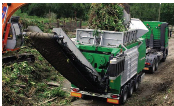
Rys. 2. Rozdrabniarka do odpadów drewna CRAMBO 6000 FOREST

Drugą nagrodzoną maszyną jest rozdrabniarka „Crambo 6000 Forest” (rys. 2). Przeznaczona jest ona do rozdrabniania różnego rodzaju drewna i odpadów zielonych. Maszyna osiąga wydajność do 125 t/h. Jest to wolnoobrotowa, dwuwalcowa rozdrabniarka, w której istnieje możliwość regulacji wielkości rozdrobnionych odpadów. Stopień rozdrobnienia jest regulowany, a wolnoobrotowe walce wyposażone w ślimakowo ułożone narzędzia rozdrabniające pozwalają na minimalizację frakcji drobnej, jak również obniżają hałas i ograniczają powstawanie zapylenia. Ustawienie odpowiedniej wielkości