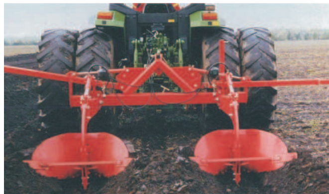
Rys. 2. Urządzenie formujące redliny Beetformer BF 2000 firmy Grimme Fig. 2. Device forming ridges Beetformer BF 2000 of company Grimme

stosowania zabezpieczeń korpusów przed uszkodzeniami. W tym celu stosuje się zabezpieczenia w postaci kołków lub układów hydraulicznych.