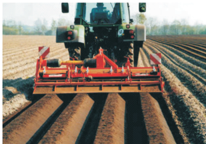
Rys. 6. Model maszyny GF 75-90/4 Eco firmy Grimme (www) Fig. 6. GF 75-90/4 Eco model of machine of Grimme company (www)

mogą być wyposażane w dodatkowe elementy do nadawania półkolistego lub trapezowego kształtu formowanym redlinom (rys. 6).