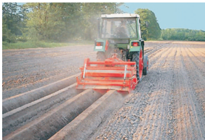
Rys. 5. Model maszyny DF 1500 firmy Grimme Fig. 5. DF 1500 model of machine of Grimme company

przesiewania, kruszenia oraz przemieszczania materiału przez przenośniki prętowe. Hydraulicznie regulowany nacisk mat umożliwi właściwe sterowanie procesem kruszenia brył. W końcowej części maszyny znajduje się zespół oddzielania dużych kamieni, które są kierowane do zbiornika, a następnie wyładowywane na skraju pola.