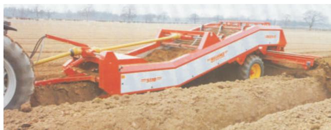
Rys. 4. Oddzielnik kamieni i grud typu 5170S firmy Reekie Fig. 4. Stones and lumps separator type 5170S of Reekie company

Oddzielacze kamieni i brył z serii Reliance (400B, 400S, 500B, 500S, 5170B i 5170S) szkockiej firmy Reekie zbudowane są z czterech lub pięciu taśm odsiewających, które mogą różnić się szczelinami międzyprętowymi (28, 32, 36, 42, 45 oraz 50 mm). W przedniej części maszyny znajdują się klawiszowe lemiesz współpracujące z obrotowym podajnikiem, który ma wymienne elementy robocze przeznaczone również do kruszenia brył (rys. 4). Nad końcowymi przenośnikami prętowymi zainstalowano dodatkowe elementy robocze w postaci „mat”, które zbudowane są z poprzecznie rozmieszczonych prętów połączonych trzema elastycznymi listwami gumowymi. Zadanie tych mat polega na wspomaganie procesu