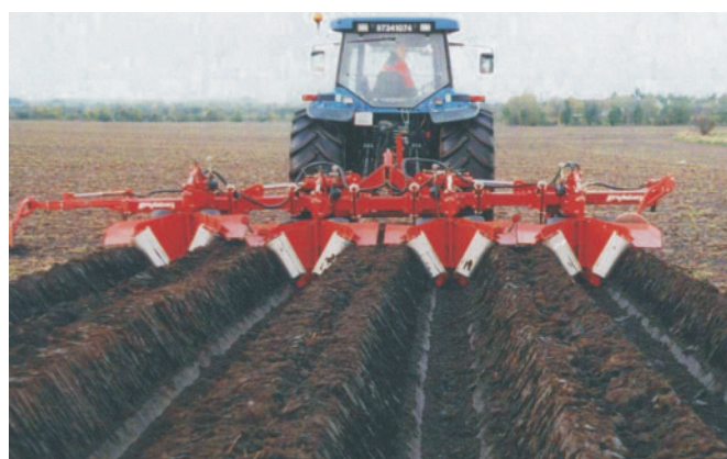
Rys. 3. Obsypnik z serii Beet-Shapeformer BSF 2000 z rolkami ułatwiającymi formowanie redlin firmy Grimme Fig. 3. Ridging plough out of a series Beet-Shapeformer BSF 2000 with rollers to facilitate the ridges formation of company Grimme