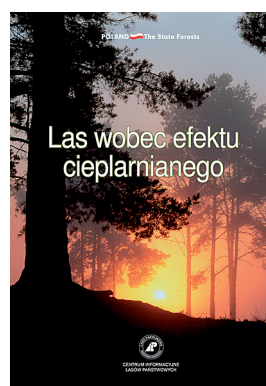
Ryc. 2. Las wobec efektu cieplarnianego Fig. 2. Forest in the face of the greenhouse effect