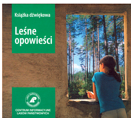
Ryc. 1. Leśne opowieści Fig. 1. Forest stories