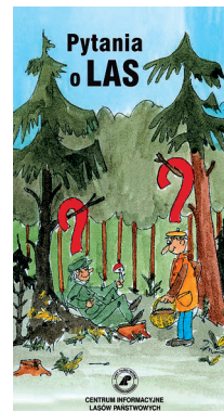
Ryc. 4. Pytania o las Fig. 4. Questions about the forest