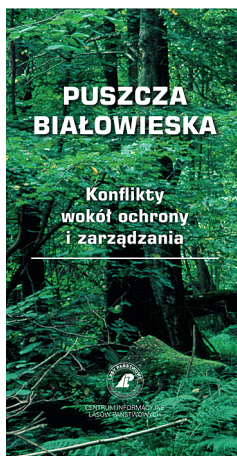
Ryc. 5. Puszcza Białowieńska Fig. 5. Białowieża Primary Forest