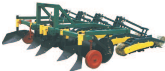
Rys. 1. Agregat do formowania redlin Sfamasz seria SWB Fig. 1. Sfamasz SWB bed-forming aggregate

Istnieje tu możliwość dostosowania docisku wałów w zależności od struktury gleby. Wały obracając się przeciwnie do kierunku jazdy, formują ostatecznie redliny nadając im odpowiednią strukturę, tj. kształtują powierzchnie boczne i górną, zagęszczają glebę i ugniatają powierzchniowo z zachowaniem miękkiego środka. Dzięki niezależnemu mocowaniu wałów szpulowych pozostają one w stałym kontakcie z glebą. Agregaty te można rozbudowywać o siewniki warzywnicze. Każda z sekcji siejących montowana jest do ramy głównej poprzez własny czworobok przegubowy (z dociskiem sprężynowym) pozwalający na ich niezależne kopiowanie terenu podczas siewu.