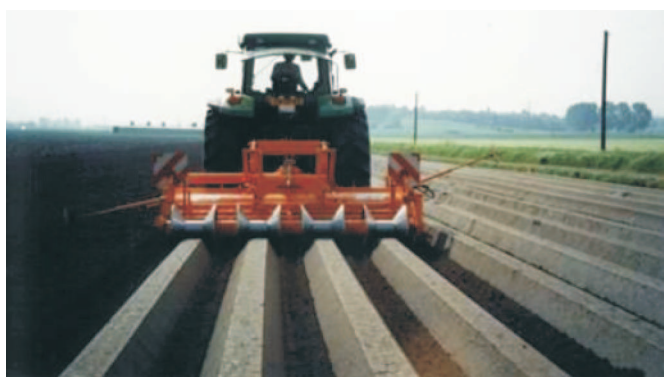
Rys. 5. Agregat do formowania redlin Struik Diabolo roller Fig. 5. Struik Diabolo roller bed-forming aggregate

Agregaty Struik do pracy na glebach cięższych Diabolo roller (rys. 5) są wyposażone w glebogryzarkę i za nią w aktywny wał szpulowy (o średnicy 48 lub 58 cm) - do zagęszczania i wyrównywania gleby - analogiczne rozwiązanie jak w modelach AUR.