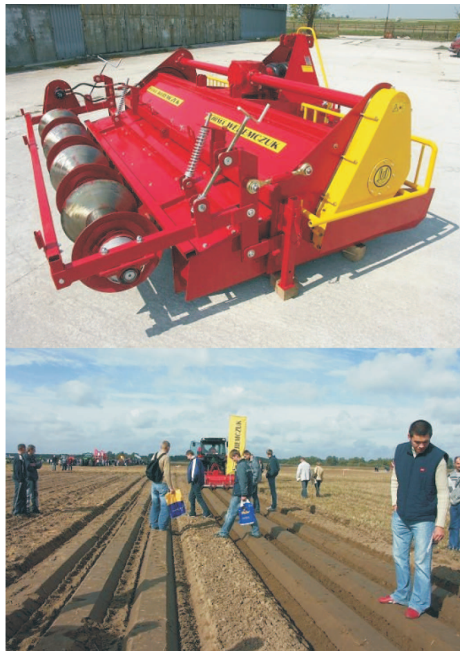
Rys. 3. Agregat do formowania redlin firmy Weremczuk AUR-4 Fig. 3. Weremczuk AUR-4 bed-forming aggregate

Na cięższe gleby firma Weremczuk ma w swojej ofercie serie AUR (2, 3 lub 4 rzędowe), które wyposażone są w gledo-