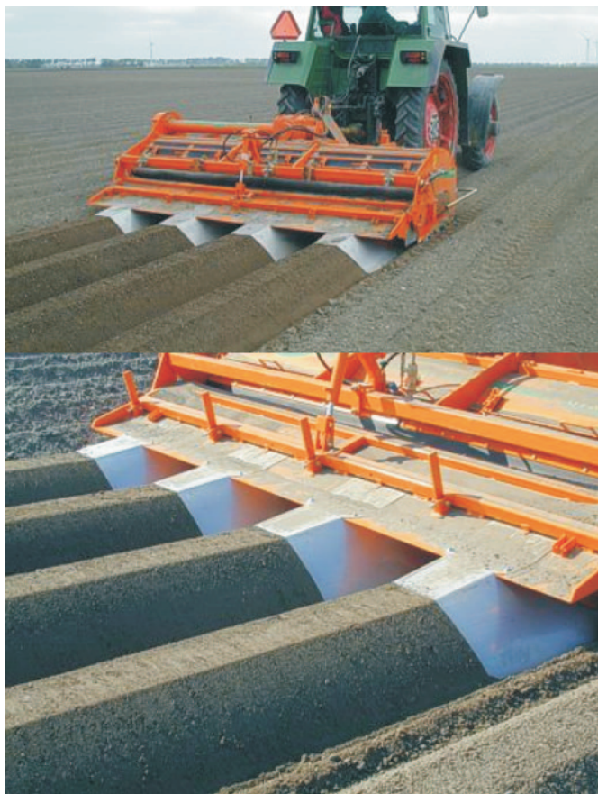
Rys. 4. Agregat do formowania redlin firmy Struik 4RF310 Fig. 4. Struik 4RF310 bed-forming aggregate