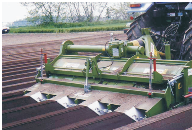
Rys. 6. Agregat Baselier 4FK310 przeznaczony na gleby ciężkie Fig. 6. Baselier 4FK310 bed-forming aggregate designed for heavy soils

430 obr/min [10]. Rozwiązanie takie jest stosunkowo mało energochłonne, bo wystarczy tu (do formowania 4 redlin) ciągnik o mocy 75 KM, czyli dwa razy mniej niż w agregatach AUR-4. Firma Baselier ma w swojej ofercie agregaty o zbliżonej konstrukcji, ale do formowania 8 redlin jednocześnie (model 8FKVB). Wykonuje on redliny o takim samym rozstawie (75 cm), waży 2760 kg i wymaga ciągnika o mocy 175 KM.