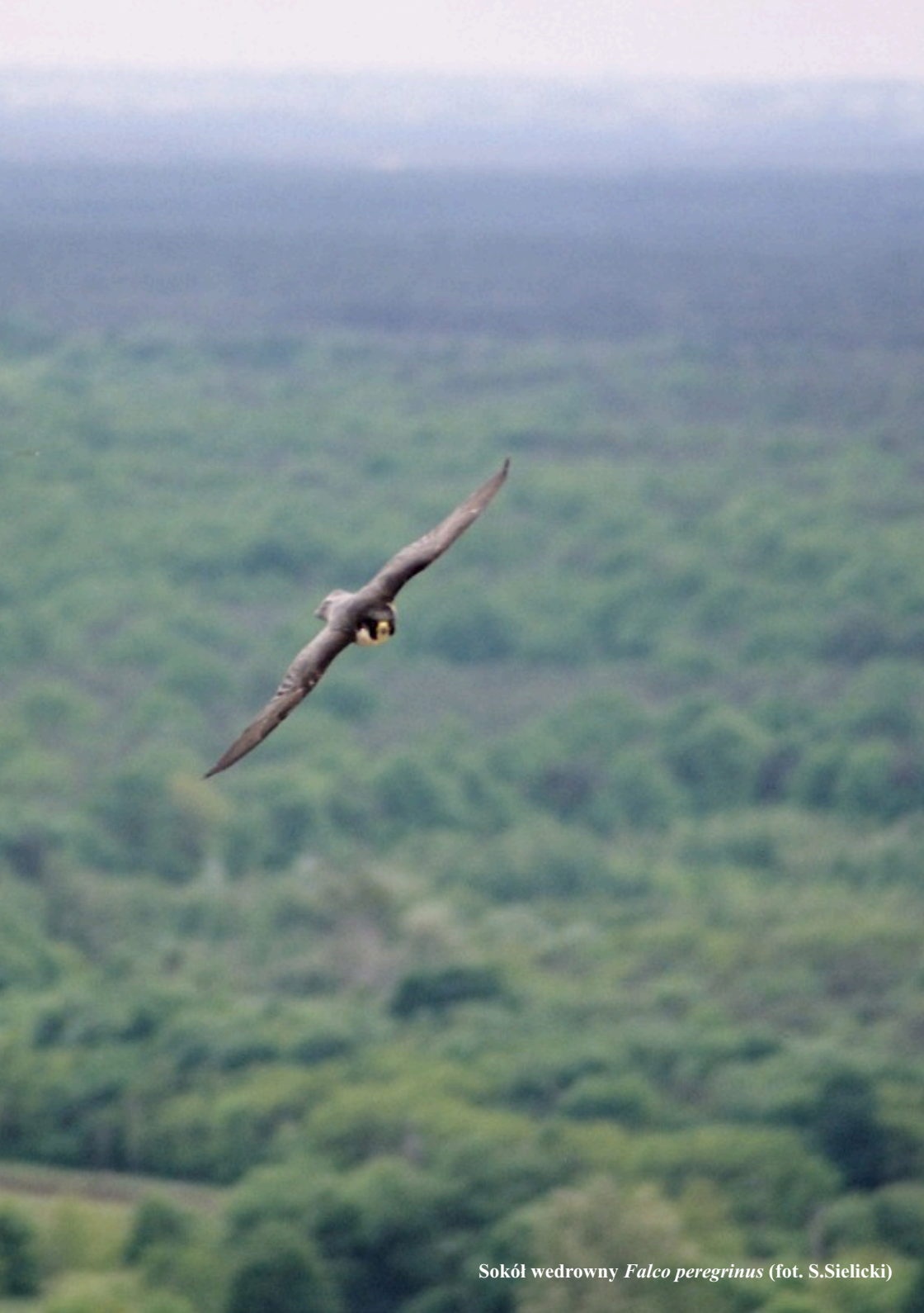
Sokół wędrowny Falco peregrinus