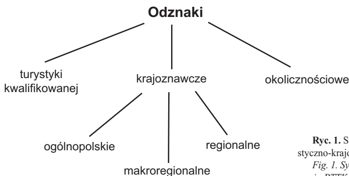
Ryc. 1. System odznak turystyczno-krajoznawczych PTTK Fig. 1. System of tourist badges in PTTK

uzyskały swobodę w ustanawianiu odznak krajoznawczych, co zaowocowało znacznym wzrostem nowych propozycji (Lewandowski 2008). Do roku 1999 ustanawiano średnio około 5 odznak rocznie. W ostatnim dziesięcioleciu, w jednym roku, przybywa przeciętnie ponad 15 nowych odznak. Rekordowy był rok 2008, kiedy to ustanowiono 34 odznaki. Szczególnie aktywny jest w tym względzie Oddział Wojskowy w Chełmie. Obecnie można zdobywać blisko 330 odznak (Lewandowski 2009, http://www.msw-pttk.org.pl/odznaki/odznaki.html ).