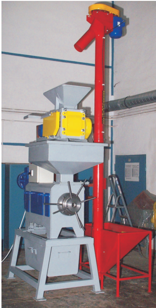
Rys. 4. Zestaw urządzeń przeznaczonych do optymalnego wyciągnięcia oleju z nasion lniarki siewnej i innych oleistych roślin drobnziarnistych