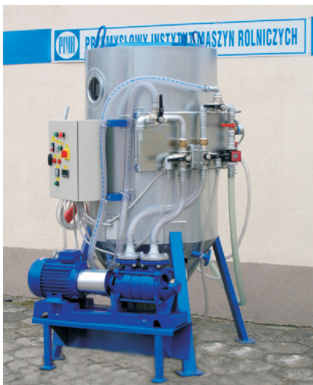
Rys. 3. Wytwórnia biopaliwa W-500 Fig. 3. W-500 the biofuel plant

Otrzymywane według tej technologii paliwo spełnia obowiązujące wymagania normy EN 14214, szczególnie ze względu na zawartość mono-, di-, i triglicerydów [3]. Technologia ta jest realizowana w wytwórni W-500M, która umożliwia produkcję biopaliwa z olejów roślinnych, m.in. z oleju rzepakowego, gorczycy, lnianki, słonecznika, soi (rys. 3).