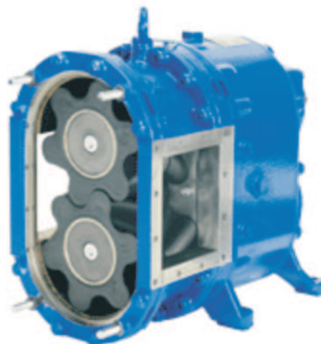
Rys. 3. Rotacyjna pompa wyporowa z dwoma wirnikami z sześciobocznymi kołami skośnymi [1]

Niemiecka firma Vogelsang oferuje rozwiązania urządzeń przeznaczonych do pompowania, homogenizowania oraz rozprowadzania płynnych nawozów organicznych. Szczególnie na zwrócenie uwagi zasługuje zespół przeznaczony do dystrybucji i rozdrabniania materiałów włóknistych znajdujących się w nawozie płynnym. Jego głównym elementem roboczym jest wirujący nóż trójramienny współpracujący z kratą znajdującą się pod nim. Do elementu rozdzielczego dostaje się następnie ujednorodniony materiał, gdzie następnie kierowany jest przez tarczę bezpośrednio do przewodów rozprowadzających. Należy tu dodać, iż mogą to być tylko węże rozlewające lub węże doprowadzające nawóz do redlic. Takie rozwiązanie zespołu rozdzielczego zapewnia dodatkową homogenizację, która realizowana jest w miejscu dostarczania nawozu do tarczy dystrybutora. Oprócz tego wymieniona firma jest producentem wielu wariantów urządzeń przeznaczonych do realizacji różnych czynności. Niektóre z nich spełniają również funkcję homogenizatora inne zaś pozwalają tylko na przepompowywanie płynnych nawozów. W zestawach tych stosowane są wydajne pompy HiFlo (rys. 3). Posiadają one dwa wirniki ukształtowane w postaci sześciobocznych kół skośnych, które zapewniają dużą wydajność i niezawodność a oprócz tego małą wrażliwość na zawartość stałych substancji w przemieszczanym nawozie płynnym [1].