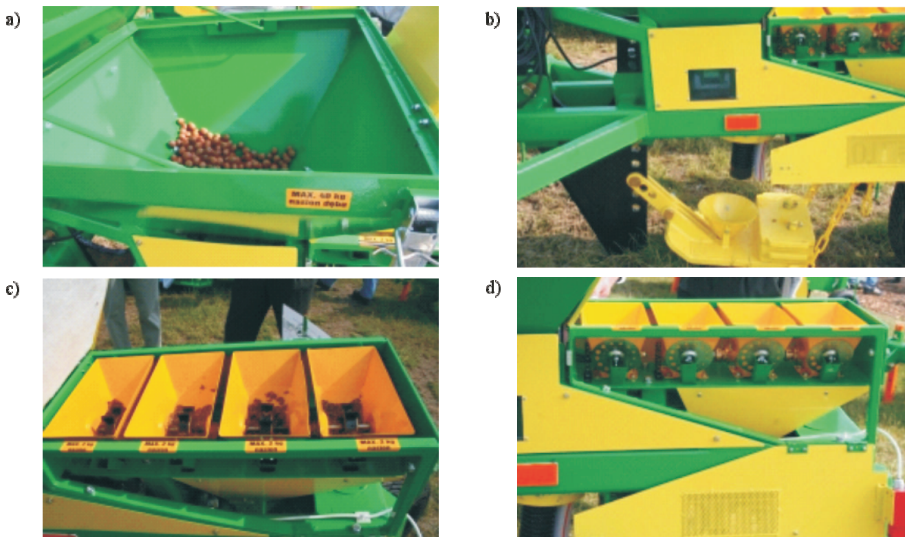
Rys. 5. Główne elementy siewnika SZU Sobańskiego: a - zbiornik siewnika dużego, b - redlica do wysiewu nasion grubych, c - zbiorniki siewnika małego, d - tarcze aparatów wysiewających siewnika małego Fig. 5. Main elements of the SZU Sobański's seeder: a - reservoir of the large seeder, b - drill coulter for sowing the large seeds, c - reservoirs of the small seeder, d - discs of sowing mechanism in small seeder

Masa forwardera gotowego do pracy wynosi około 12 100 kg. Pojemność zbiornika paliwa to ponad 120 litrów. Mimo tego, że forwarder ten jest maszyną ośmiokołową, to nominalny kąt skrętu wynosi w przypadku tej maszyny 44°, dzięki zastosowaniu innowacyjnego rozwiązania technologicznego wózków