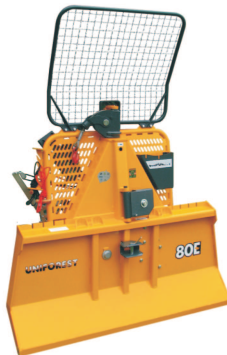
Rys. 8. Jeden z modeli wciągarek firmy Uniforest o sile uciągu 80 kN Fig. 8. One of Uniforest's models of hoisting winches of drawbar power 80 kN

bezpieczeństwa i jakości pracy wyroby Uniforest otrzymały również certyfikat niemiecki KWF.