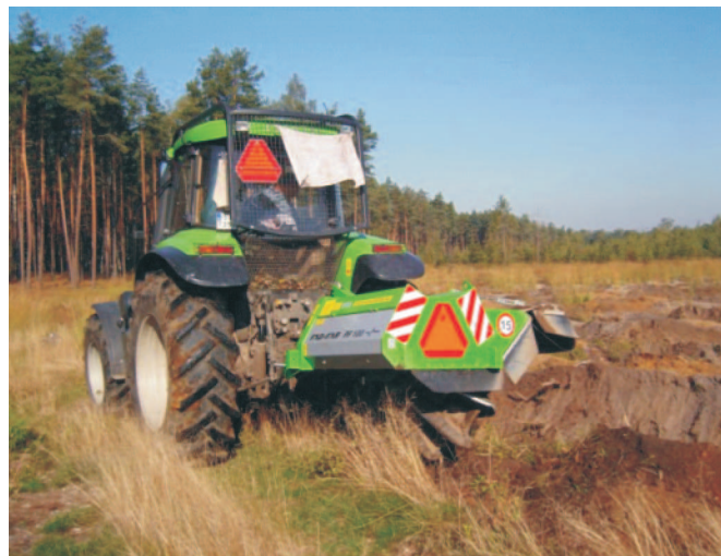
Rys. 10. Pługofrezarka PF 100 firmy Fao Far podczas wykonywania rabatowalków

nawijaniu się na jego oś korzeni, gałęzi, drutów i lin. Podstawowe parametry techniczne tej maszyny to: głębokość robocza 50 cm, szerokość rowu około 60 cm, zapotrzebowanie na moc 66-118 kW, masa własna 850 kg, wydajność 0,4-1,5 ha/8 h.