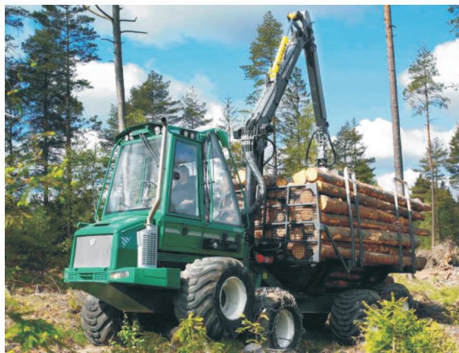
Rys. 6. Forwarder Greemo 1050 F Fig. 6. Forwarder Greemo 1050 F

tandemowych typu bogie. W niektórych warunkach, szczególnie podczas prac trzebieżowych, istnieje możliwość uniesienia wózków tandemowych typu bogi w taki sposób, że tylko jedno z kół każdego z czterech wózków ma styk z podłożem (staje się zatem wtedy maszyną czterokołową), dzięki zamontowanym do tych wózków siłownikom hydraulicznym (rys. 7). Standardowo maszyna wyposażona jest w hydrauliczny żuraw Loglift o wysięgu 7,2 m i momencie udźwigu brutto 78 kNm, chwytak Cranab oraz wyjmowane zespoły kłonic umożliwiające przebrojenie forwardera w klembank (po zamocowaniu opcjonalnej ławy kłonicowej). Dodatkowo w maszynie tej zastosowano nowe oprogramowanie GreControl, które oprócz zmniejszenia zużycia paliwa, łatwiejszej obsługi i zmniejszenia hałasu umożliwia sterowanie hydraulicznie napędzanego wentylatora chłodnicy w taki sposób, że co około 30 min następuje zmiana kierunku jego obracania się w celu przyczyszczenia radiatora chłodnicy.