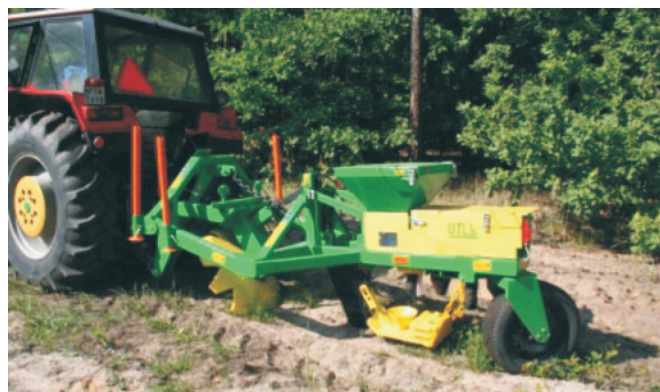
Rys. 4. Siewnik SZU Sobańskiego podczas pracy Fig. 4. The SZU Sobański's seeder working

Firma Smallgis z Krakowa na zlecenie Regionalnej Dyrekcji Lasów Państwowych w Krakowie opracowała serwis internetowy „Lasy HCVF” traktujący o tzw. szczególnych wartościach przyrodniczych lub kulturowych ( High Conservation Value Forest ), gdzie oprócz wyznaczonej, zgodnie z obowiązującymi kryteriami w standardzie HCVF utworzonym przez FSC ( Forest Stewardship Council ), czyli Międzynarodowy System Certyfikacji Gospodarki Leśnej, tzw. „Mapie lasów o szczególnych walorach przyrodniczych (HCVF)”, utworzono dodatkowo internetowy serwis mapowy zawierający również informację na temat form ochrony przyrody w postaci warstw informacyjnych mapy numerycznej oraz zintegrowane i przetworzone warstwy numeryczne LMN (Leśnej Mapy Numerycznej) z Nadleśnictw będących w obszarze administracji RDLP w Krakowie.