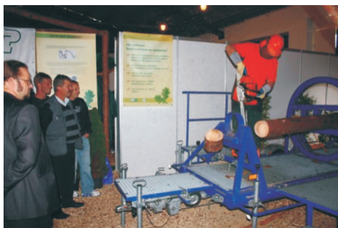
Rys. 1. Symulator naprężeń w przerywanej kłodzie (pokaz przerywki)

W hali bezpieczeństwa i jakości znajdowały się również trzy stanowiska symulacyjne: stanowisko do symulacji naprężeń w przerywanej kłodzie (rys. 1), stanowisko umożliwiające pokazanie odbicia pilarki oraz stanowisko do symulacji uderzeń i skutków powstałych podczas uderzenia w nieosłoniętą i osłoniętą kaskiem głowę operatora, przez drewniany kołek imitujący spadającą gałąź.