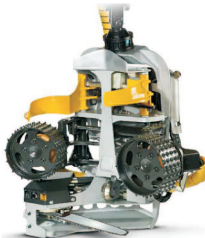
Rys. 3. Głowica harwesterowa Kesla 18 RH Fig. 3. Harvester head Kesla 18 RH

rozmiarów głowica harwesterowa Kesla 18 RH (rys. 3) o masie 450 kg sprawia, że jest to idealna maszyna przeznaczona do prac trzebieżowych. Wymiary tej głowicy to około 1,10 m wysokości i 1,14 m szerokości. Maksymalna średnica ścinanych drzew wynosi 45 cm. Głowica wyposażona jest w 18-calową prowadnicę, po której przemieszcza się napędzana przez silnik hydrauliczny o pojemności 19 cm 3 piła łańcuchowa o podziałce 0,404 cala. Przemieszczania drzew między trzema nożami okrzesującymi (dwoma ruchomymi i jednym stałym) dokonują stalowe, ażurowe walce posuwowe z prędkością 5 m/s i momentem posuwu równym 19 kN. Maksymalna średnica okrzesywania wynosi 38 cm. Zgodnie z zaleceniami producenta agregatowany z nią ciągnik powinien dysponować mocą w granicach 60-80 kW i wydajnością pompy hydraulicznej w zakresie 170-200 l/min przy ciśnieniu około 200 barów.