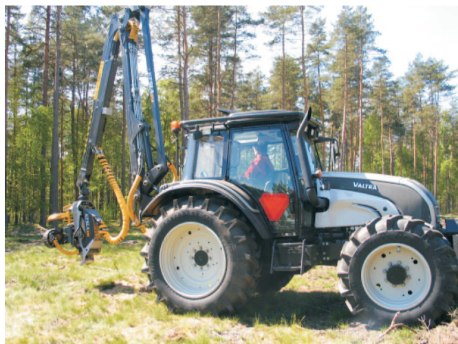
Rys. 2. Ciągnik Valtra N 121 HiTech z zamontowaną na wysięgniku głowicą harwesterową Kesla 18 RH Fig. 2. The tractor Valtra N 121 HiTech with harvester head 18 RH installed on the jib

Zestaw aplikacji komputerowych do wprowadzania i kontroli danych dla powierzchni kołowych PK, MPK i PK-kontrola ma na celu łatwiejsze wprowadzanie danych i bardziej sprawne obliczanie parametrów powierzchni pomiarowych i kontrolnych w metodzie stosowanej od wielu już lat w Lasach Państwowych, której głównym celem jest zebranie informacji o zapasie drewna (miąższości, wysokości, pierśnicy i stanie liczebny drzew) na danej powierzchni leśnej.