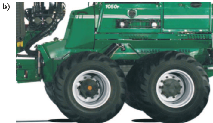
Rys. 7. Forwarder Greemo 1050 F z uniesionymi przednimi wózkami bogie (a), siłownik hydrauliczny unoszenia prawego przedniego koła wózka tandemowego (b) Fig. 7. Forwarder Greemo 1050 F with raised front carts bogie (a), the hydraulic servo-motor for lifting out the right front wheel of tandem cart (b)