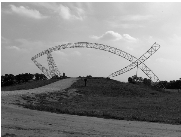
Ryc. 2. Brama-Ryba zwiększyła zainteresowanie ziemią lednicką.

Na obszarze przez dziesięciolecia odwiedzanym przez turystów tylko ze względu na Muzeum na Lednicy w 1997 roku pojawił się nowy obiekt przyciągający rzesze wędrowców – ośrodek duszpasterski ojców dominikanów w Imiolkach, z metalową konstrukcją Bramy III Tysiąclecia w kształcie ryby (Ryc. 2). Na „modlitwne czuwania” nad Lednicą wiosną przybywa 80-100 tys. osób. Jesienią odbywa się „Lednica Seniora”. Te spotkania gromadzą ludzi z całej Polski i Europy wiedzionych pobudkami religijnymi, ale także ciekawością. W czasie pomiędzy spotkaniami pole odwiedzają liczni turyści przyciągani sławą miejsca (Chojnacka, Wilkaniec 2008 a).