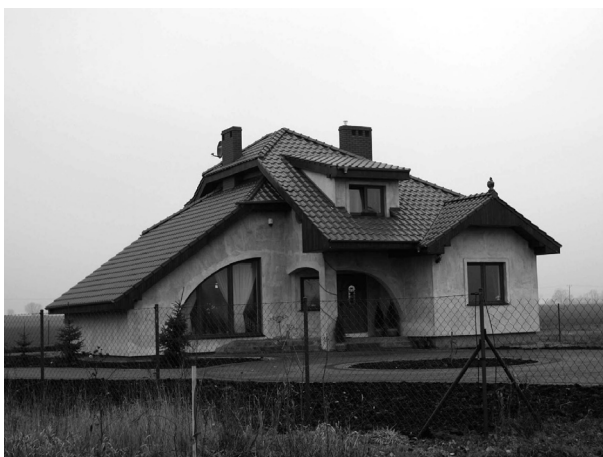
Ryc. 5 .Współcześnie stawiane na Lednicy domy odbiegają od form tradycyjnych. Fig. 5. Present-day build house in Lednica region – different from traditional forms of rural buildings.