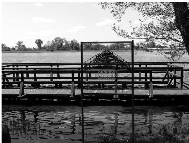
Ryc. 3. Wizualizacja średniowiecznego mostu i nowy pomost dla turystów na brzegu Ostrowa Lednickiego.

W ostatnich latach Muzeum na Lednicy, przez ponad 30 lat główny walor turystyczny regionu, uatrakcyjniło swoją ofertę adaptując na potrzeby wystawiennicze wyremontowane pomieszczenia dawnego folwarku. Wcześniej zaniedbane, użytkowane przez spółdzielnię produkcyjną obiekty zostały zrewaloryzowane i dzięki nowym, jasnym elewacjom są wyraźnie widoczne w krajobrazie pól. Odsłonięto także przykryte ziemią stare nawierzchnie brukowe podwórza i drogi dojazdowej. Uporządkowano zabytkowy park otaczający siedzibę dyrekcji muzeum posadowioną na fundamentach dawnego dworu. Tzw. Mały Skansen, czyli część muzeum towarzysząca przeprawie promowej na wyspę lednicką zyskała nową oprawę dzięki wybudowaniu drewnianej palisady nawiązującej do średniowiecznych budowli warownych. Przy zachodnim brzegu wyspy pojawił się okazały pomost ułatwiający oglądanie relikwii przyczółka mostu łączącego w X w. Ostrów Lednicki z brzegiem jeziora (Ryc. 3.). Najcenniejszy zabytek na Lednicy – księżęce palatium z kaplicą – uzyskało ostatnio nowe zadaszenie (Ryc. 4.). Olbrzymie zapotrzebowanie na miejsca parkingowe w szczycie sezonu spowodowało konieczność wybudowania dwóch nowych parkingów: przy Wielkopolskim Parku Etnograficznym i przeprawie promowej na Ostrów Lednicki. Wytyczono także nową, biegnącą przez pola asfaltową drogę dojazdową i zamknięto dla ruchu dotychczas istniejącą trasę i wjazd przez stylizowaną, drewnianą bramę.