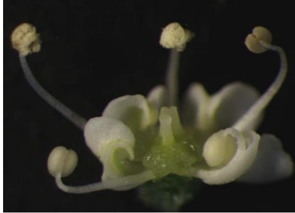
Fot. 1. Męskopłodny kwiat marchwi Photo 1. Male fertile flower of carrot

Otrzymane wyniki dotyczące rozmnażania generatywnego męskopłodnych genotypów marchwi potwierdzają tezę, że warunki uprawy mają istotny wpływ na wydajność tworzenia nasion (Michalik 1993, Szafirowska-Walędzik 1997), a warunki polowe są optymalnymi dla ich reprodukcji. Dobra produktywność nasienna wyhodowanych i badanych w Zakładzie Genetyki, Hodowli i Biotechnologii linii marchwi potwierdza ich wysoką wartość hodowlaną zarówno w fazie wegetatywnej (Kozik i in. 2011), jak i w fazie generatywnej opisanej w niniejszym doniesieniu. Wyniki efektywnego wykorzystania muchy domowej oraz pszczoły samotnicy, jako owadów zapylających, mają duże znaczenie praktyczne i umożliwiają wybór najlepszej metody zapylania.