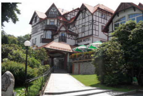
Fot.12. Wielofunkcyjny Park-Hotel znakomicie wkomponowany w stok wzgórza (fot. E. Gonda-Soroczyńska, lipiec 2013)

Foto 11. The modernised „Sloneczko” sanatorium (photograph by E. Gonda-Soroczyńska, July 2013)