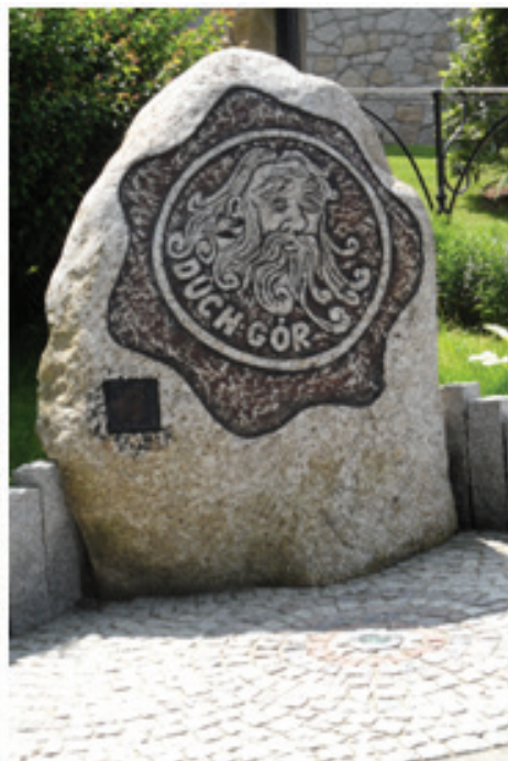
Fot. 14. Element małej architektury nieopodal Park-Hotelu – obelisk na cześć Ducha Gór (fot. E. Gonda-Soroczyńska, lipiec 2013)

Foto. 13. Kurhaus, the St. Lukas Spa House (photograph by E. Gonda-Soroczyńska, July 2013)