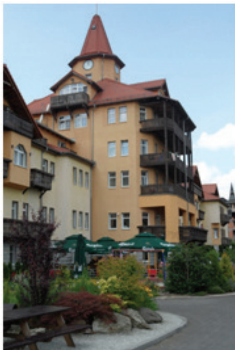
Fot.13. Kurhaus, Dom Zdrojowy St. Lukas (fot. E. Gonda-Soroczyńska, lipiec 2013)

Foto. 13. Kurhaus, the St. Lukas Spa House (photograph by E. Gonda-Soroczyńska, July 2013)