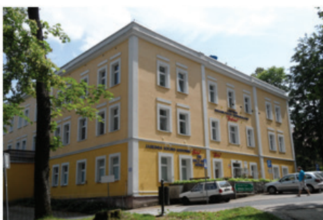
Fot.10. Niepubliczny Zakład Opieki Zdrowotnej „Centrum Rehabilitacji i Reumatologii – Goplana” (fot. E. Gonda-Soroczyńska, lipiec 2013)

Foto. 9. The „Waclaw” Spa Hospital (photograph by E. Gonda-Soroczyńska, July 2013)