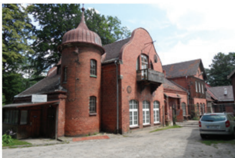
Fot. 15. Zakład kuracji borowinowej – dawniej Łazienki Marii z 1904 roku (fot. E. Gonda-Soroczyńska, lipiec 2013)