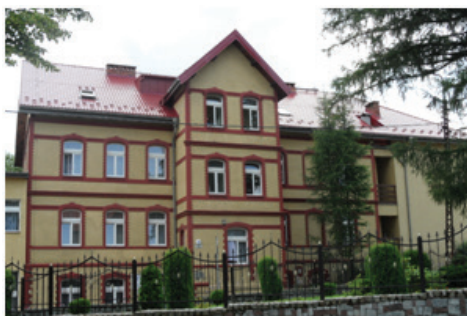
Fot.9. Szpital Uzdrawiskowy „Waclaw”

Foto. 9. The „Waclaw” Spa Hospital