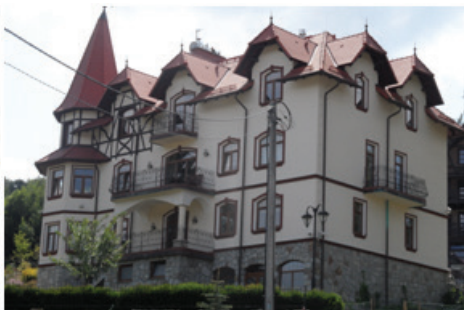
Fot.5. Dom wypoczynkowy w stylu architektury sudeckiej (fot. E. Gonda-Soroczyńska, lipiec 2013)