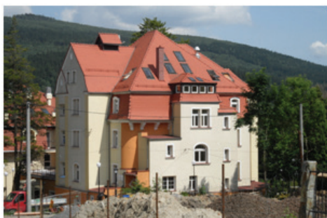
Fot.11. Sanatorium „Sloneczko” po modernizacji (fot. E. Gonda-Soroczyńska, lipiec 2013)

Foto. 10. The „Goplana” Rehabilitation and Rheumatology Centre, a non-public health care facility (photograph by E. Gonda-Soroczyńska, July 2013)