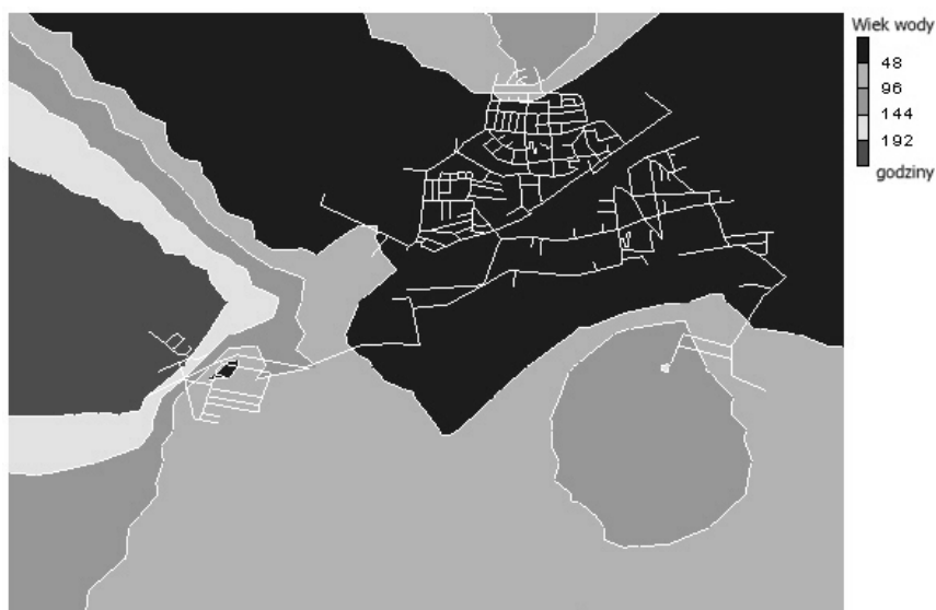
Rysunek 6 Wiek wody w wodociągu w Łapach w czasie symulacji trwającej 240 godzin