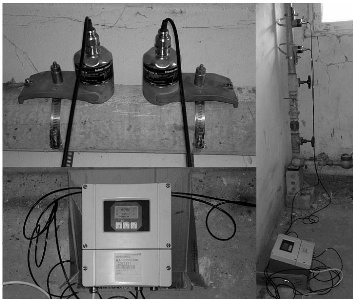
Rysunek 2 Przenośny przepływomierz ultradźwiękowy do tymczasowych pomiarów przepływu cieczy z zewnątrz rurociągu Proline Prosonic Flow 93T