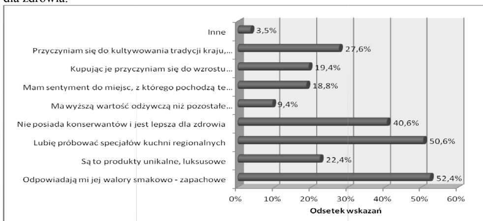
Rys. 2. Przyczyny skłaniające do zakupu żywności tradycyjnej i regionalnej

Głównymi czynnikami, dla których konsumenci wybierają tradycyjne produkty spożywcze, są wyjątkowe walory smakowo-zapachowe, oraz chęć próbowania nowych smaków kuchni, charakterystycznych dla regionu z którego potrawa pochodzi. Konsumenci cenią sobie także żywność tradycyjną, ponieważ ufają że jest w odróżnieniu od ogólnodostępnej żywności konwencjonalnej, wolna od konserwantów, przez co jest lepsza dla zdrowia.