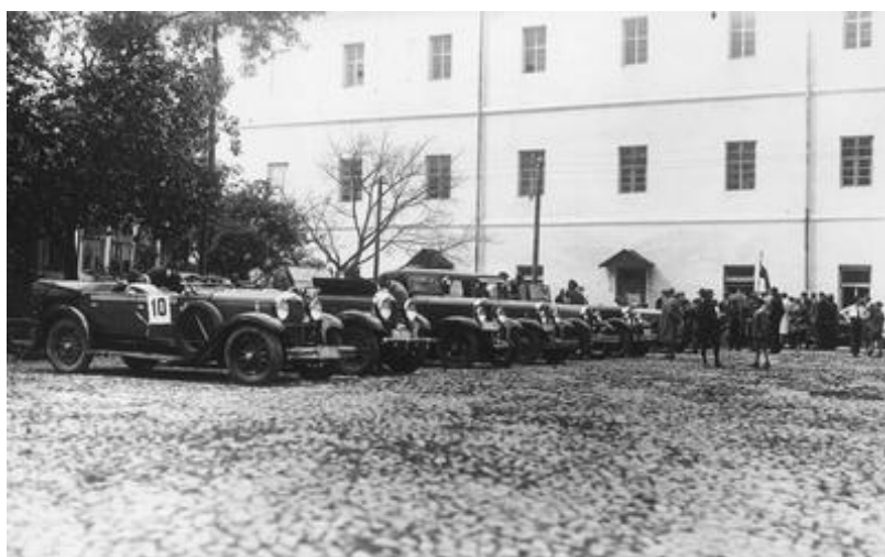
Fot. 4. Rajd Wołyńskiego Klubu Automobilowego – start w Łucku (czerwiec 1930 r.). Uczestnicy rajdu przed startem

Jednym z największych sukcesów sportowych piłkarzy nożnych Wołynia na arenie ogólnopolskiej był awans zespołu WKS Łuck do finału mistrzostw Polski juniorów w 1939 r. 32 W ćwierćfinale rozgrywek piłkarze WKS Łuck pokonali WKS Śmigły Wilno (2:0, w Wilnie), natomiast w półfinale zwyciężyli zespół KS Strzelec Górka Stanisławów (2:1). W finale rozgrywek WKS Łuck miał zmierzyć się ze zwycięzcą drugiego półfinału HCP Poznań – Wisła Kraków. Mecz półfinałowego i finałowego nie rozegrano ze względu na wybuch II wojny światowej.