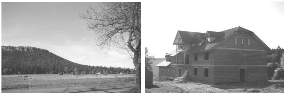
Ryc. 3. Jedne z wielu nowych inwestycji: a) powstające nowe powierzchnie parkingowe, b) budynek usługowo-turystyczny.

Zgodnie z zapisami planu wieś może powiększać tereny zabudowy, co może spowodować znaczne powiększenia sieci osadniczej. W efekcie badań terenowych stwierdzono zachodzące zmiany w obrębie obu części. Po pierwsze w umownie nazwanym centrum Karłowa następuje znaczny rozwój punktów gastronomicznych, tworzenie nowych powierzchni parkingowych jak również nowych budynków usługowo-turystycznych (ryc. 3). Natomiast w części oddalonej następuje powolne zagęszczenie zabudowy oraz wprowadzanie budownictwa odbiegającego od występującej architektury.