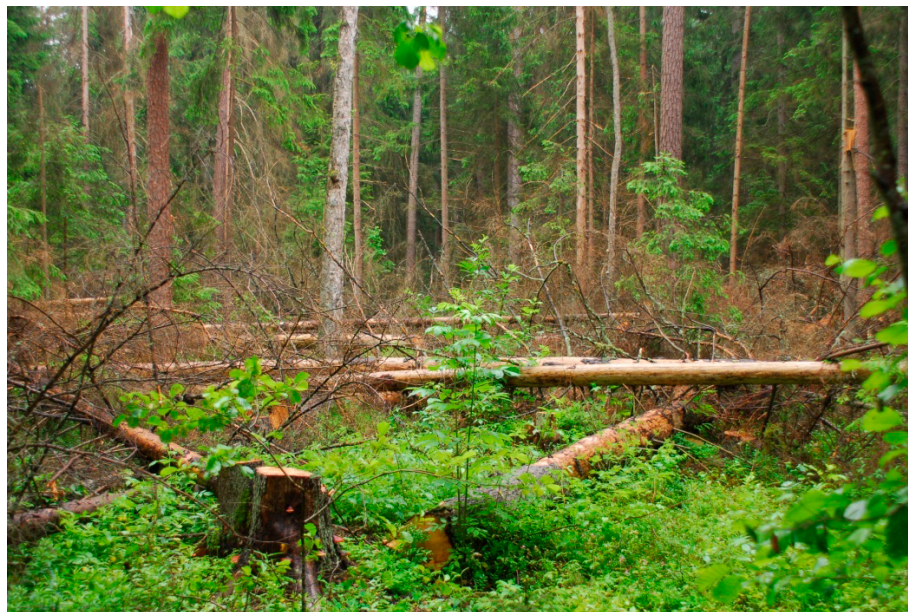
Rysunek 3 Obszar Puszczy Białowieskiej

zwierzęta leśne które chciałby obejrzeć, zrobić zdjęcie, a w tym przypadku może tylko narazić się na kontuzję.