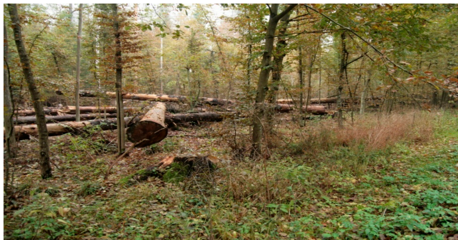
Rysunek 4 Obszar Puszczy Białowieskiej