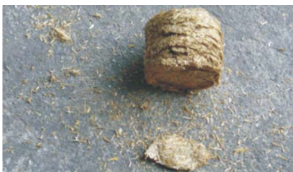
Rys. 4. Brykiet ze słomy żytniej po zrzucie Fig. 4. Briquette of rye straw after dropping