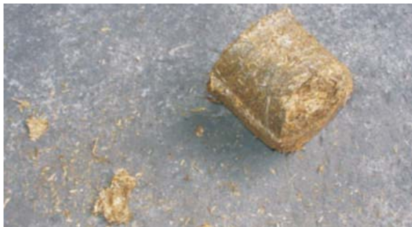
Rys. 1. Brykiet ze słomy jęczmiennej po zrzucie Fig. 1. Briquette of barley straw after dropping

pszenżytniej i żytniej mają zbyt dużą różnicę w ubytku masy pomiędzy próbami, wynoszącą 7,9% w przypadku brykietu ze słomy pszenżytniej i aż 12,9% w przypadku brykietów ze słomy żytniej. Można również zaobserwować, że po trzecim zrzucie, brykiet ze słomy żytniej wykazuje tendencje do „plastrowania” (rys. 4), co nie jest cechą korzystną w przypadku stosowania brykietów w małych systemach grzewczych, np. gospodarstwach indywidualnych. Rozwarstwianie brykietów bowiem powoduje przyspieszenie procesu spalania, a tym samym zbyt szybkie zużycie paliwa.