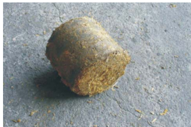
Rys. 7. Brykiet ze słomy kukurydzianej po zrzucie Fig. 7. Briquette of maize straw after dropping