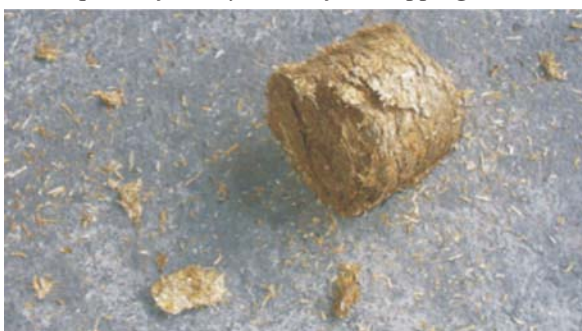
Rys. 2. Brykiet ze słomy pszenicznej po zrzucie Fig. 2. Briquette of wheat straw after dropping