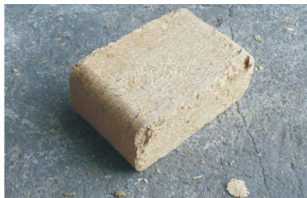
Rys. 8. Brykiet z trocin po zrzucie Fig. 8. Briquette of sawdust after dropping