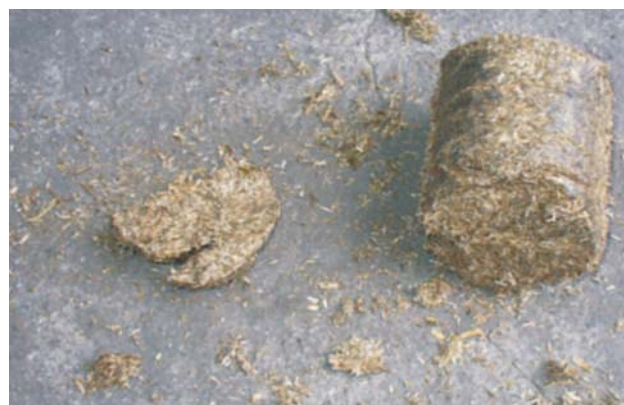
Rys. 6. Brykiet ze słomy rzepakowej po zrzucie Fig. 6. Briquette of rape straw after dropping