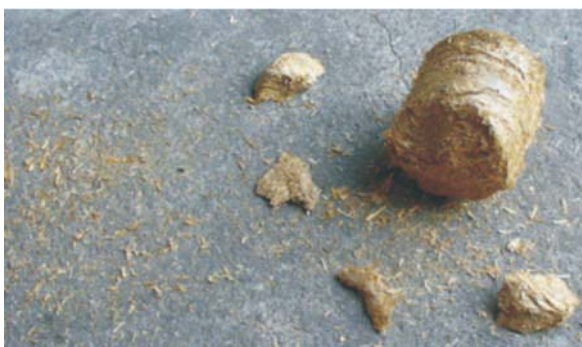
Rys. 3. Brykiet ze słomy pszenżytniej po zrzucie Fig. 3. Briquette of triticale straw after dropping