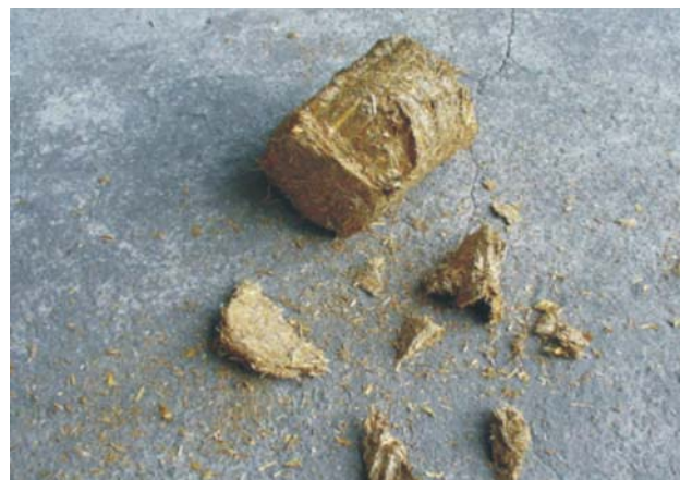
Rys. 5. Brykiet ze słomy owsianej po zrzucie Fig. 5. Briquette of oat straw after dropping