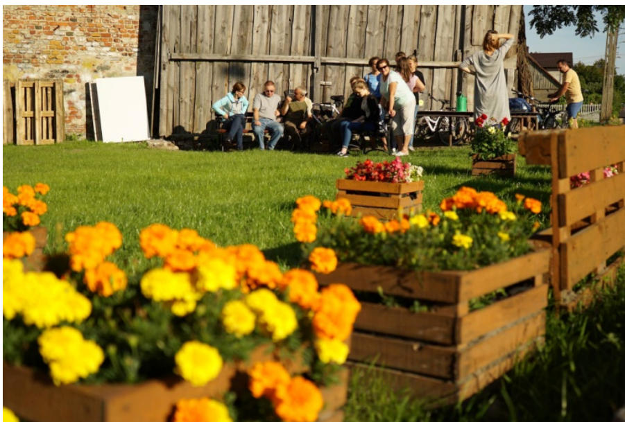
Fot. 1. Kwiaty w ogrodzie społecznym Photo 1. Flowers in community garden

Prace nad organizacją zawodów przebiegały w harmonijny sposób. Wszyscy współorganizatorzy wykazali duże zaangażowanie w przygotowanie i przeprowadzenie zawodów, które odbyły się 1 października 2016 r. Współpraca przebiegła pomyślnie i do początku 2018 r. zostały przeprowadzone już trzy tego typu zawody, które obecnie noszą nazwę Power Challenge (fot. 3).