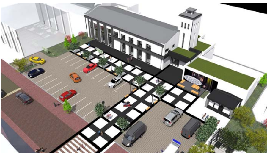
Ryc. 1. Wizualizacja budynku Starej Elektrowni Fig. 1. Visualization of Stara Elektrownia building