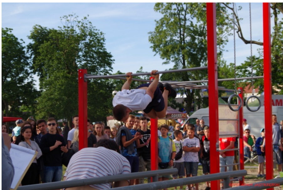
Fot. 3. Mistrzostwa Ostrowi Mazowieckiej w podciąganiu na drążku