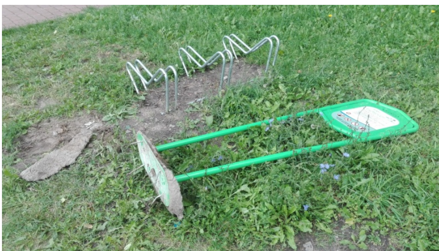
Fot. 2. Siłownia zewnętrzna przy ul. Partyzantów Photo 2. Street workout on Partyzantów Street