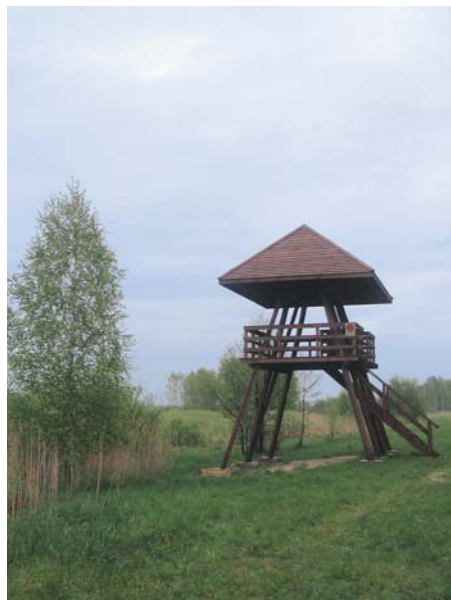
Fot. 4. Wieża widokowa na skraju Łąk Zienkowskich

Photo 3. A footbridge on the Splawy nature path