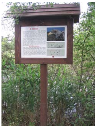
Fot. 1. Ornitologiczna tablica informacyjna na trasie ścieżki przyrodniczej Perehod Photo 1. Ornithological information board on the nature path Perehod

Wyznaczono tu także kilka ścieżek przyrodniczych: „Perehod” (początek w miejscowości Pieszowola), „Dąb Dominik” (początek w miejscowości Łomnica), „Splawy” (początek w miejscowości Załucze Stare), „Żółwik” (ścieżka dla dzieci w Załuczu Starym); jedną ścieżkę przyrodniczo-historyczną „Obóz powstańczy” (początek w miejscowości Lipniak) oraz jedną ścieżkę rowerową „Mietiułka” (początek w miejscowości Łowiszów). Wszystkie ścieżki wyposażone są w tablice informacyjne (fot. 1), mapy (fot. 2), przystanki z opisami, zadaszenia, parkingi, wieże widokowe, a także urządzenia ułatwiające poruszanie się po terenach podmokłych i torfowiskach: drewniane kładki, platformy i mostki (fot. 3).