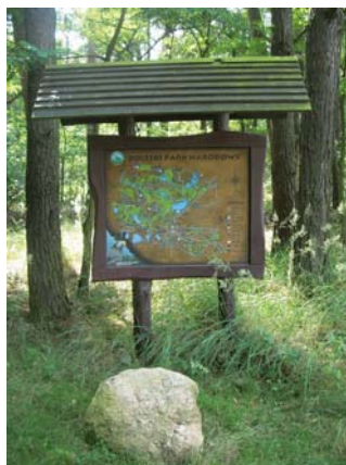
Fot. 2. Tablica z mapą Poleskiego Parku Narodowego przy początku ścieżki przyrodniczej Perehod Photo 2. Polesie National Park map board – at the start of the nature path Perehod