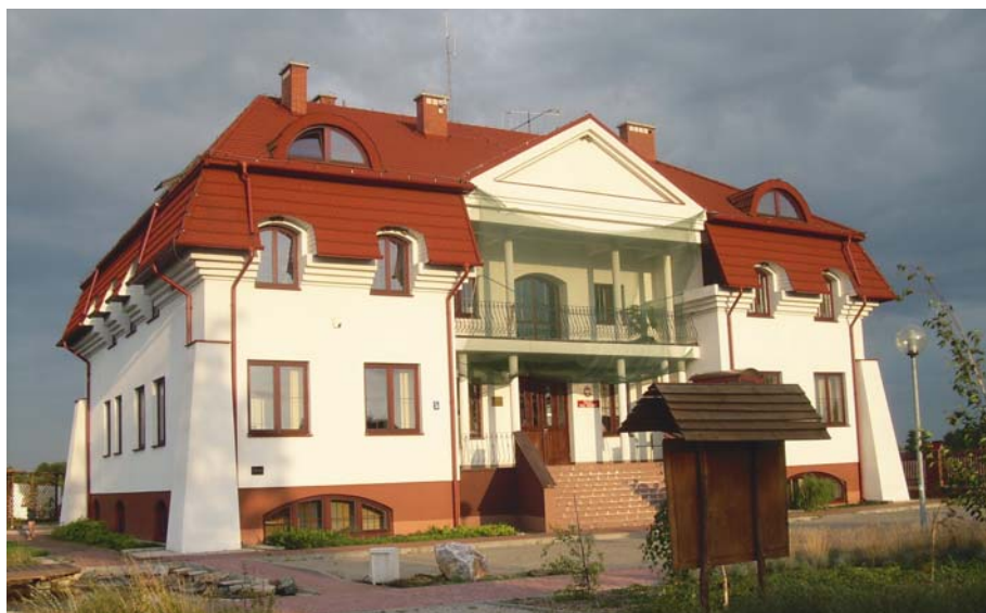
Fot. 5. Ośrodek Dydaktyczno-Administracyjny i siedziba Dyrekcji PPN w Urszulinie Photo 5. The Teaching and Administrative Centre of Polesie National Park in Urszulin