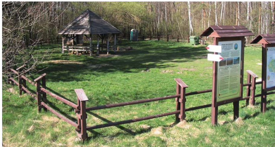
Fot. 6. Pole biwakowe PPN w Łomnicy

Na terenie parku istnieje możliwość uprawiania turystyki pobytowej, ale tylko po wniesieniu odpowiednich opłat i w wyznaczonych miejscach biwakowania tj. na polach wypoczynkowych Babsk, Łomnica (fot. 6), Pieszowola, Łowiszów i Stare Załucze ( Zarządzenie Nr 1/2013 z dnia 31.12.2012 r. ... ). W tych miejscach zlokalizowano także parkingi, umieszczono zadania turystyczne ze stołami i ławami do siedzenia, a także wyznaczono miejsca pod ogniska (Różycki in. 2002).