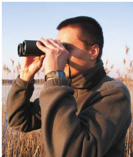
Fot. 7. Autor podczas obserwacji ornitologicznych nad jeziorem Moszne w PPN Photo 7. The author during ornithological observations on the lake Moszne in PNP

Niestety należy stwierdzić, że turystyka ornitologiczna na obszarze PPN nie ma w tej chwili znaczącego udziału w ogólnym ruchu turystycznym na terenie parku. Z uzyskanych podczas wywiadu z adiunktem parku ds. edukacji informacji wynika, że zorganizowane grupy o charakterze typowo ornitologicznym odwiedzają park sporadycznie. Jak do tej pory obok kilku tego typu grup polskich pojawiły się także pojedyncze grupy z Wielkiej Brytanii, Niemiec, Holandii, Belgii, Szkocji oraz Francji. Nie oznacza to jednak, że turystyka ornitologiczna na tym terenie jest w zupełnym zaniku, gdyż z moich obserwacji i wywiadów wynika, że park jest miejscem eksploracji ornitologicznych prowadzonych przez osoby indywidualne (fot. 7) lub małe grupy, głównie z woj. lubelskiego, a także przez obserwatorów ptaków z woj. mazowieckiego, małopolskiego, śląskiego, a w pozostałych przypadkach z innych województw.