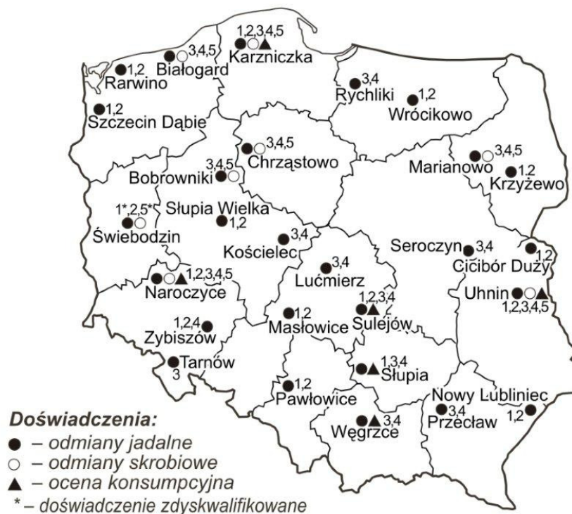
Rys. 2. Dwuletnie doświadczenia COBORU na terenie Polski

1 – odmiany bardzo wczesne jadalne, 2 – wczesne jadalne, 3 – średnio wczesne jadalne, 4 – średnio późne i późno jadalne, 5 – średnio wczesne skrobiowe, 6 – średnio późne i późne skrobiowe