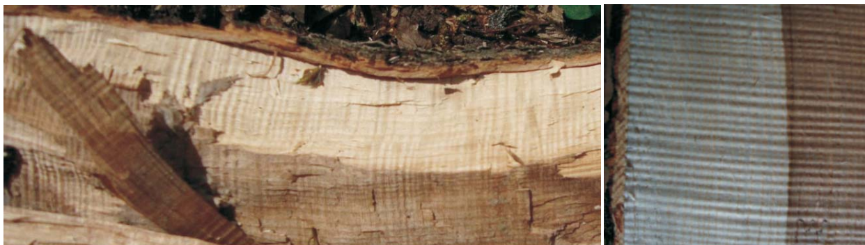
Rycina 1. Drewno o falistym układzie włókien jesionu wyniosłego rosnącego na Ukrainie Figure 1. The wavy-grained wood of common ash growing in Ukraine

kości anomalii w budowie drewna, ich liczby itp., chociaż wartość ozdobna drewna jesionowego ma znaczenie w kontekście klasyfikacji opartej na cechach ilościowych i jakościowych (Yatsenko-Khmelewskyy 1954; Rioux et al. 2003; Vintoniv et al. 2007; Sopushynskyy 2006, 2012).