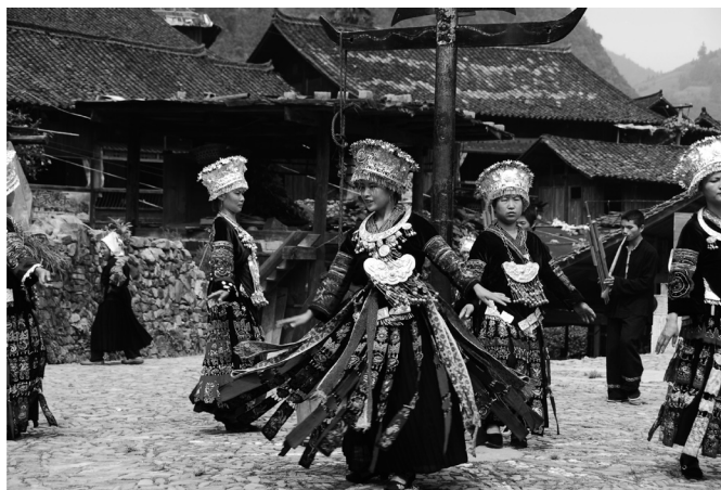
Fot. 11. Występy taneczne ludności Miao (E. Papińska, 2007). Photo 11. The dance performance of Miao People (E. Papińska, 2007).

Mniejszość Miao zamieszkuje w prowincjach Guizhou, Hunan, Yunnan, Sichuan, Guangxi, Hubei i na wyspie Hajnan (ryc. 1). Szacuje się, że na terenie Chin populacja tej ludności dochodzi do 9 mln. Miao zamieszkują głównie obszary górskie, odwadniane przez kilka większych rzek. Duże opady atmosferyczne umożliwiają uprawy zbóż, które stanowią główne źródło utrzymania. Posiadają swój język, który ze względu na znaczne rozproszenie tej ludności i izolację pewnych grup, występuje w 3 dialektach. Ludność Miao znana jest przede wszystkim z bogatych strojów, zdobionych srebrną biżuterią (fot. 11). Występy folklorystyczne prezentujące tradycyjne tańce, śpiewy, obrzędy cieszą się dużym uznaniem turystów. Stosunkowo niewiele jest wiosek, w których można obejrzeć taki spektakl. Artyści, którzy na co dzień są rolnikami, bezpośrednio po występie