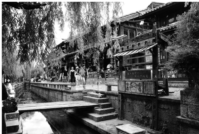
Fot. 14. Lijiang – prowincja Yunnan (E. Papińska, 2008).

Photo 13. Dongba sorcerer – Naxi People (E. Papińska, 2008).