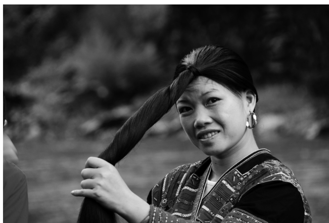
Fot. 7. Kobieta z mniejszości Yao (E. Papińska, 2007). Photo 7. Woman from Yao Minority (E. Papińska, 2007).

Dostosowanie stoków górskich głównie pod uprawy ryżu ma swoją wielowiekową tradycję. Uprawy terasowe w rejonie Longsheng kultywowane są od czasów dynastii Ming, czyli od ponad 6 stuleci (fot. 6). Przez ten czas układ pól zmienił się w niewielkim stopniu. Turyści przyjeżdżający do Guilin, głównie w celu odbycia rejsu po rzece Li i podziwiania wielkich mogotów, coraz częściej odwiedzają także wioski Yao w rejonie Longsheng. Zalane wodą pola, układające się w kaskadowe wąskie listwy schodzące w dół do dna doliny nie pozostawiają nikogo obojętnego na takie widoki, stają się dużą atrakcją turystyczną. Podziwiać można także ogromny kunszt sztuki budowlanej i rozplanowania przestrzeni, którą można wykorzystać do zabudowy w tak trudnym terenie. Dodatkową atrakcją stanowi możliwość poznania tradycji i zwyczajów tej mniejszości. Do takich zaliczyć należy