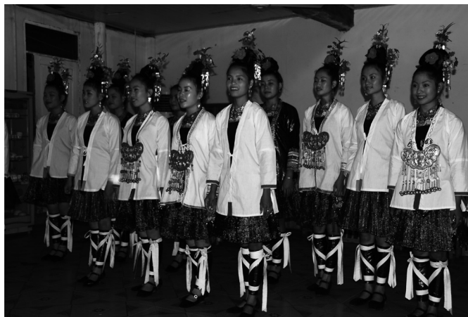
Fot. 10. Kobiety Dong podczas występów (E. Papińska, 2007). Photo 10. Dong women during performances (E. Papińska, 2007).

Szacuje się, iż mniejszość Dong liczy obecnie ok. 3 mln ludności. Zamieszkują tereny prowincji Hunan, Guangxi i Guizhou (ryc. 1). Posiadają swój język lecz nie używają własnego pisma. Ludność Dong znana jest poza granicami Chin, gdyż ich reprezentacja (fot. 10) zwyciężyła na Międzynarodowym Festiwalu Folklorystycznym we Francji, głównie dzięki ciekawie brzmiącemu śpiewie chóralnym.