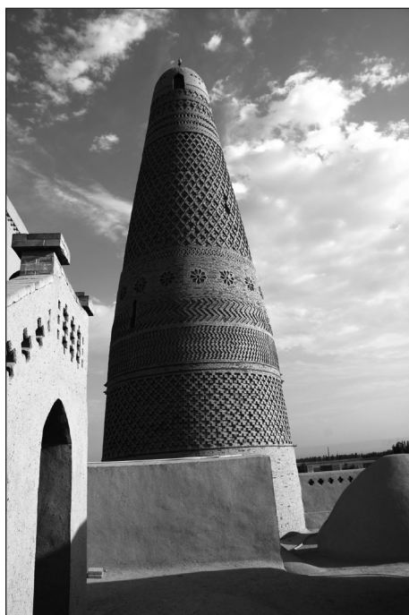
Fot. 2. Minaret w stylu irańskim z 1778 r. Turpan (E. Papińska, 2008). Photo 2. Minaret in Iranian style from 1778. Turpan (E. Papińska, 2008).