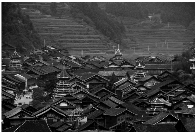
Fot. 8. Zhao Xing – najpiękniejsza wioska mniejszości Dong (E. Papińska, 2007). Photo 8. Zhao Xing - the most beautiful village of Dong Minority (E. Papińska, 2007).

Ludność Dong znana jest przede wszystkim z niezwykle ciekawej architektury, głównie mostów „Wiatru i Deszczu” oraz charakterystycznych Wież Bębnow. Niektóre wsie mają specyficzny układ przestrzenny, wynikający z liczby rodów zamieszkujących daną osadę. Wioska Zhao Xing (fot. 8) uważana jest za najpiękniejszy przykład wsi mniejszości Dong. Zamieszkuje ją pięć rodów, a każdy z nich ma swoją Wieżę Bębnow, pełniącą ważną rolę w życiu tej społeczności. Brak surowców kamiennych w okolicy, wpłynął na opanowanie do perfekcji przez ludność Dong sztuki budowania wszelkich budowli z drewna, bez użycia gwoździ. Poszczególne rody rywalizują wręcz w budowie najładniejszych wież i mostów. Za najlepszy przykład sztuki budowlanej uchodzi most Wiatru i Deszczu – Fengyu qiao (fot. 9), wybudowany na rzece Linxi w rejonie Chengyang w 1916 r. Posiada on 5 pawilonów wybudowanych w różnych stylach. Oprócz celów praktycznych, mosty pełniły rolę świątyń poświęconych duchom rzek.