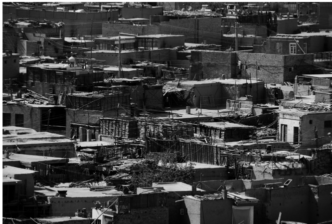
Fot. 4. Stare miasto w Kaszgarze (E. Papińska, 2008). Photo 4. Old Town in Kashgar (E. Papińska, 2008).