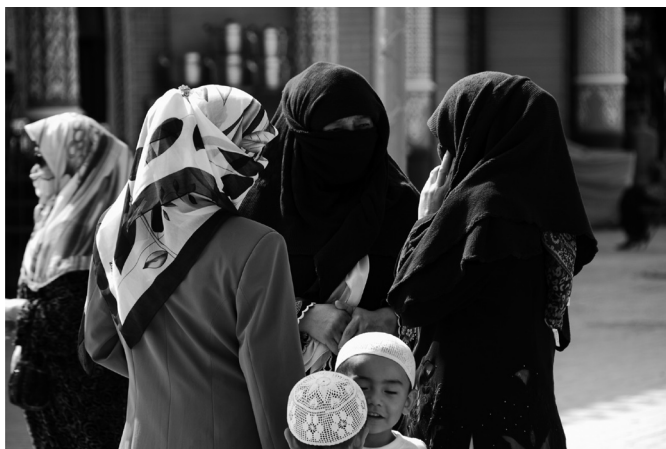
Fot. 5. Kobiety Ujgurskie w tradycyjnych nakryciach głowy (E. Papińska, 2008). Photo 5. Uyghurs women in traditional headgear (E. Papińska, 2008).