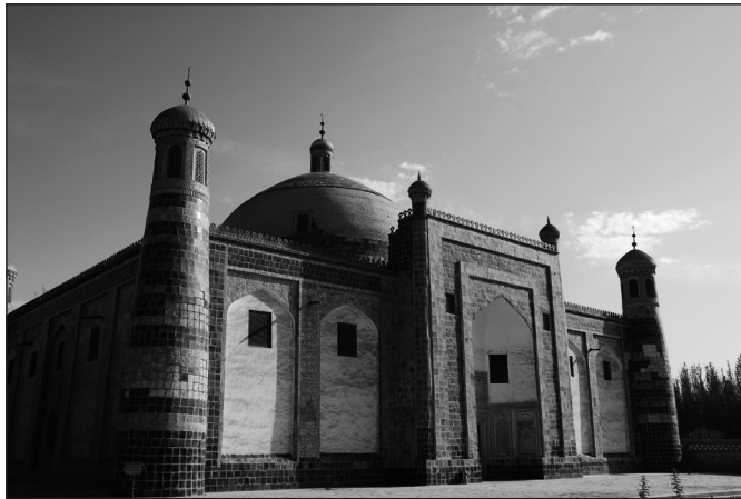
Fot.3. Mauzoleum Abacha Chodzy z XVII w. Kaszgar (E. Papińska, 2008). Photo 3. The tomb of Abakh Khoja from XVII century. Kashgar (E. Papińska, 2008).