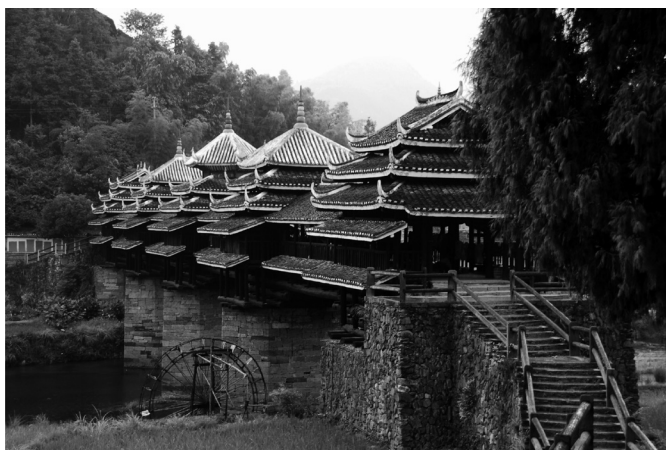
Fot. 9. Most Fengyu qiao to najładniejszy most „Wiatru i Deszczu” w rejonie Chengyang (E. Papińska, 2007). Photo 9. The Fengyu qiao Bridge is the most beautiful Rain and Wind Bridge in Chengyang region (E. Papińska, 2007).