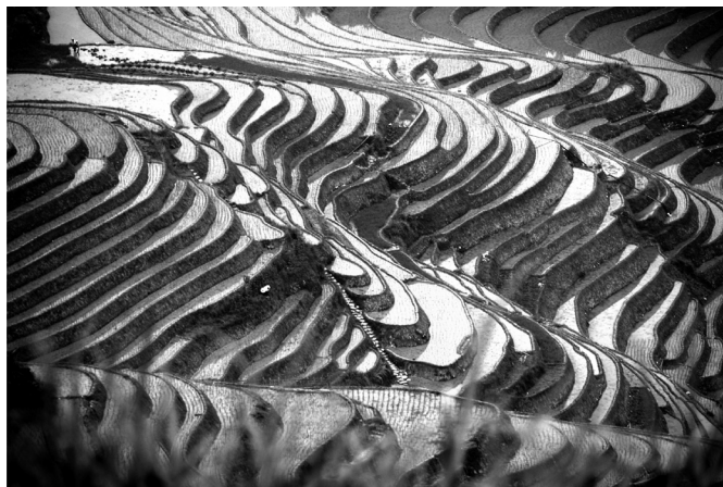
Fot. 6. Pola terasowe Longji (E. Papińska, 2007). Photo 6. The rice terraces Longji (E. Papińska, 2007).

Mniejszość Yao zamieszkuje południowe Chiny od ok. 2000 lat. Około 70% ludności Yao spośród całej populacji szacowanej na 2,6 mln skupia się w Regionie Autonomicznym Guangxi Zhuang, pozostali w prowincjach Hunan, Yunnan, Guangdong, Guizhou i Jiangxi. Ludność Yao zasiedliła doliny i obszary górskie położone często powyżej 1000 n.p.m. Trudny pod względem zagospodarowania teren został sterasowany i przygotowany pod uprawy. Dziś główne źródło utrzymania daje im rolnictwo (uprawa ryżu), polowania i rybołówstwo.