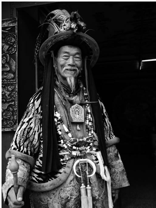
Fot. 13. Szaman Dongba – ludność Naxi.

zdecydowały o odbudowie miasta w starym stylu architektonicznym ludu Naxi. Było to podyktowane faktem, że tradycyjne rozwiązania budowlane znacznie lepiej stawily czoła trzęsieniu ziemi.