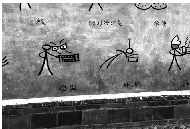
Fot. 12. Hieroglify Dongba (E. Papińska, 2008). Photo 12. Hieroglyphs Dongba (E. Papińska, 2008).

Niezwykle interesująca mniejszość Naxi, licząca zaledwie 300 tys. osób, zamieszkuje przedgórze Himalajów w północno-zachodniej części prowincji Yunnan, i południowo-zachodnią część prowincji Syczuan (ryc. 1). Fascynuje swoją kulturą, religią oraz używanym od ponad 1000 lat pismem hieroglificznym Dongba (fot. 12), które jest pismem piktograficznym i ideograficznym. Interesujące jest także to, iż lud Naxi posługuje się także pismem sylabicznym – Geba. W zbiorach muzealnych zgromadzonych w Instytucie Badań nad Kulturą Dongba w Lijiang znajdują się ponad 20 000 woluminów, w których opisano w języku Dongba: kulturę ludu Naxi, filozofię, religię, literaturę, historię, zagadnienia dotyczące medycyny i astronomii (Li Chunsheng Chen Yong 2007). Tłumaczeniem tekstów zajmuje się około 30 szamanów (fot. 13).