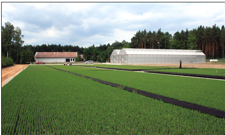
Fotografia 1. Otwarte pole produkcyjne i namioty foliowe w szkółce kontenerowej Bielawy

o pojemności 120 cm 3 , a dla brzozy i lipy 24 pojemniki o pojemności 250 cm 3 każdy. Przez ok. 1 miesiąc kontenery znajdowały się w namiocie foliowym, który zapewnia optymalne warunki mikroklimatyczne do rozwoju siewek. W celu maksymalizacji wykorzystania linii produkcyjnej, sadzonki po miesiącu intensywnego wzrostu przeniesiono na zewnętrzne pole zraszania, gdzie pozostały do końca cyklu produkcyjnego (fot. 1).