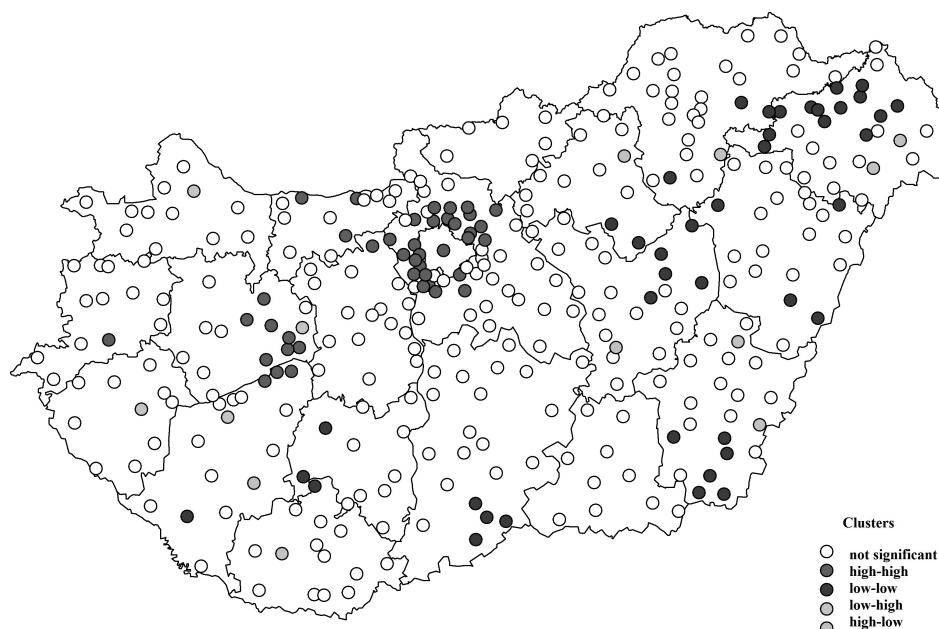
Figure 3. Local Moran I clusters of cities in Hungary according to the Complex Resilience Index, 2018

Zmiany w klasyfikacjach skupień sugerują, że różnica w Złożonym Wskaźniku Odporności pomiędzy miastami zwiększa się w czasie, a w konsekwencji skupienia Lokalnego Współczynnika Morana I zmniejszają się.