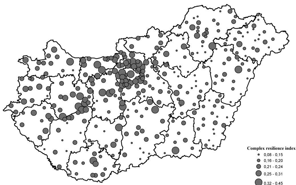
Figure 1. Complex Resilience Index values by cities in Hungary, 2018

itp. Oprócz tego można przytoczyć inne badania dotyczące częściowo podobnych wzorców rozwoju miast na Węgrzech i przedstawione tu analizy odporności.