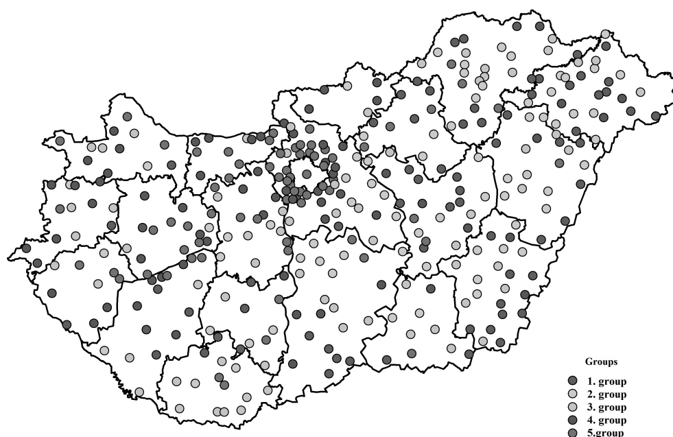
Figure 4. Classification of Hungarian cities in Hungary by Complex Resilience Index, 2018

Igal, Lengyeltóti, Kadarkút itp.). Druga grupa, czyli druga piąta, również zlokalizowana jest głównie we wschodniej części kraju i na obrzeżach Kraju Zadunajskiego i obejmuje małe miasteczka (Encs, Putnok, Sajószentpéter, Edelény, Vásárosnamény, Nyírlugos, Vámospércs, Kistelek, Szabadszállás, Kunszentmiklós, Szentlőrinc, Csurgó, Pécsvárad, itp.). Trzecia piąta, czyli trzecia grupa miast, jest rozproszona po całym kraju, choć nieco ważniejsza jest tu rola Kraju Zadunajskiego (Alsózsolca, Felsőzsolca, Fehérgyarmat, Makó, Csongrád, Harkány, Siklós, Villány, Bóly, Sárbogárd, Sümeg, itp.). Czwarta grupa zlokalizowana jest głównie w Kraju Zadunajskim i aglomeracji Budapesztu (Pécel, Maglód, Gyál, Ócsa, Szob, Komárom, Kőszeg, Szentgotthárd, itp.). Do najlepiej sytuowanych gmin należy większość gmin Budapesztu i jego aglomeracji (Szentendre, Dunakeszi, Budaörs, Érd, Törökbálint, itp.), a także większość stolic powiatów i dynamicznych miast (Miskolc, Debreczyn, Segedyn, Pecz, Győr, Kecskemét, Székesfehérvár, Eger, Szekszárd, Veszprém, Szombathely itp.), ale też jedno lub dwa miasta przemysłowe (Tiszaújváros, Paks, Kazincbarcika itp.), jak również rozwinięte miasta nad Balatonem (Keszthely, Balatonfüred, Siófok, Balatonlelle, Balatonalmádi itp.). Dane te pokazują spadek rozwoju z zachodu na wschód, które jest widoczne w kilku krajach Europy Środkowo-Wschodniej (Bąk, 2023).