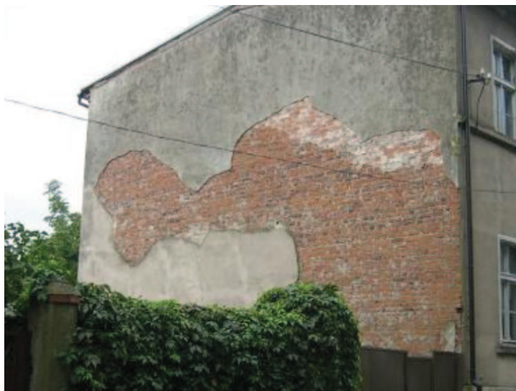
Fot 2. Przykład elementu krajobrazu odbieranego negatywnie przez uczniów. Photo 2. An example of negative reaction to a given element of a landscape.

Zastosowanie percepcji krajobrazu w edukacji turystycznej na poszczególnych etapach kształcenia pozwoli na przygotowanie młodego człowieka do uprawiania turystyki, pokazanie odpowiednich form zachowań, spójność ze środowiskiem przyrodniczym. Wchodząc w dorosłe życie z umiejętnością patrzenia, słuchania, wdychania, dotykania, smakowania środowiska młodzież stanie się pełnoprawnym i świadomym uczestnikiem ruchu turystycznego. Metody badawcze stosowane w percepcji krajobrazu pozwoliły młodzieży uwierzyć, że mogą przyczynić się do kształtowania środowiska geograficznego, że mogą wpłynąć na zmiany w zagospodarowaniu turystycznym oraz mogą przyczynić się do poprawy atrakcyjności wizualnej swojej miejscowości. Poczucie, że można być uczestnikiem w kształtowaniu lokalnego środowiska, wyzwoliło u młodych ludzi odpowiedzialność i spójność ze środowiskiem przyrodniczym i kulturowym oraz pozwoliło na zmianę postawy z biernej na bardziej aktywną w lokalnej społeczności. Wprowadzenie percepcji krajobrazu do programów nauczania przyrody, geografii, biologii i przedmiotów z zakresu turystyki spowoduje zmiany w sposobie podejścia do ekologii, ochrony środowiska przyrodniczego oraz uprawiania turystyki.