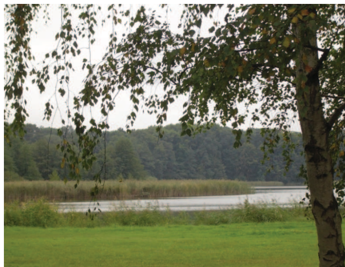
Fot 1. Przykład elementu krajobrazu odbieranego pozytywnie przez uczniów.

Map 1. Positive and negative location of the evaluated landscape according to students responses about Jeziorna Street.