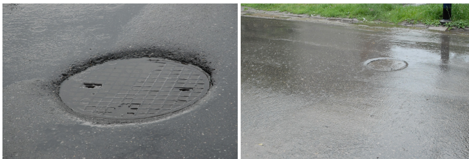
Rysunek 1. Przykłady włączów kanalizacyjnych usytuowanych poniżej powierzchni terenu w chwili wystąpienia opadu atmosferycznego Figure 1. Examples of the sewerage system hatches located below the area surface during the precipitation

Observacje prowadzone w terenie, w okresie opadów deszczu, dają podstawę do przypuszczeń, że znaczna część wód deszczowych przedostaje się do kanalizacji przez otwory we włączach studzienek kanalizacyjnych usytuowanych poniżej poziomu terenu (rys. 1).