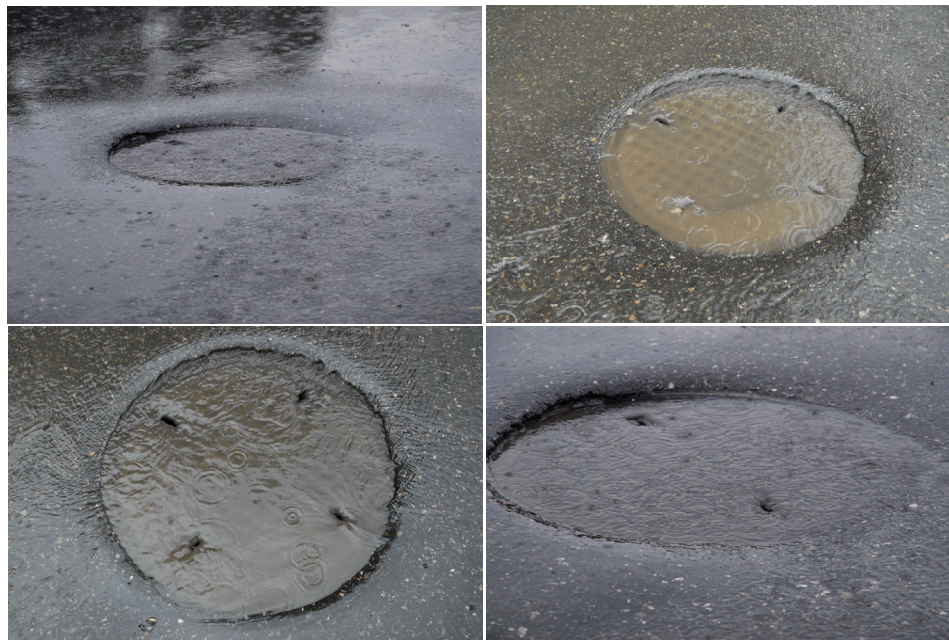
Rysunek 2. Przykłady przelewania się spływających wód deszczowych przez otwory we włazach do wnętrza studzienek kanalizacyjnych Figure 2. Examples of the precipitation water overflow through the holes into the sewage chambers